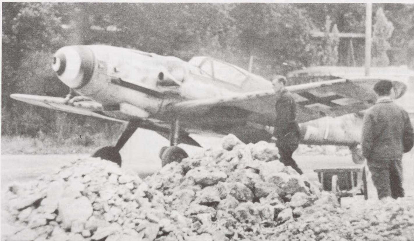
Et fly af samme type, Messerschmitt Bf 109, som styrtede ved Skrødstrup i januar 1945.