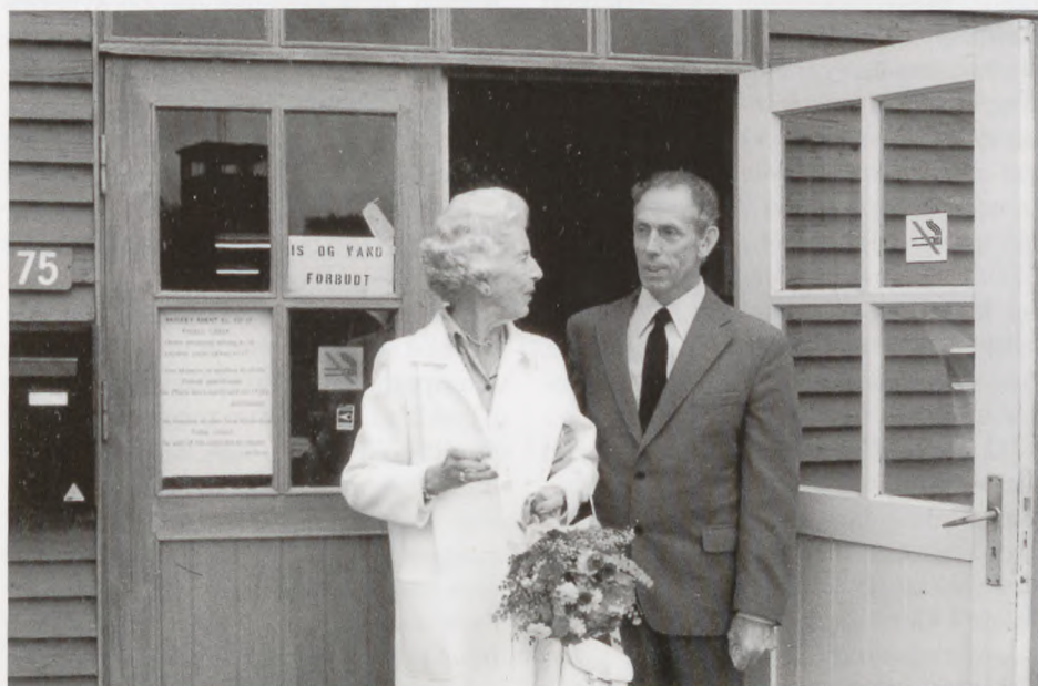
Dronning Ingrids besøg i »Frøslevlejrens museum 1980«, hvor jeg var daglig leder i 12 år og holdt 4.000 foredrag for skoler, foreninger m.m.