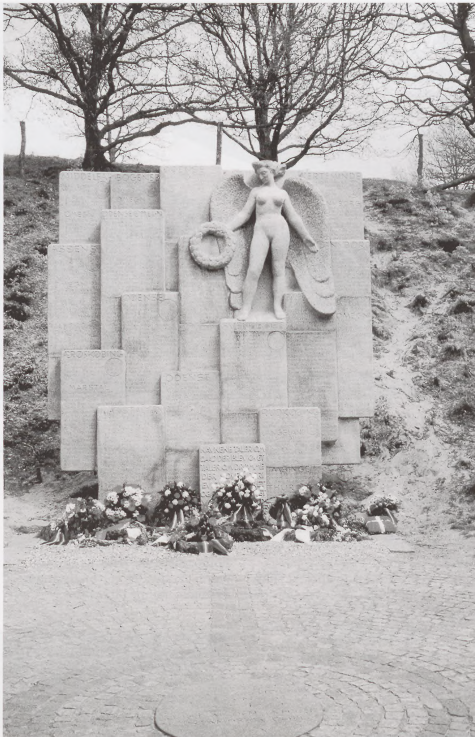
Frøbjerg-Bavnehøj med de smukke kranser og blomster, der lægges hvert år 5. maj.

For at noget sådant og for at søge at forhindre krige blev et internationalt system, FN, formuleret af ca. 50 nationer. I dag består FN af ca. 150 nationer og har som sådan løst mange mellemstatslige problemer, men lige netop nu kunne FN ikke løse Irak krisen.