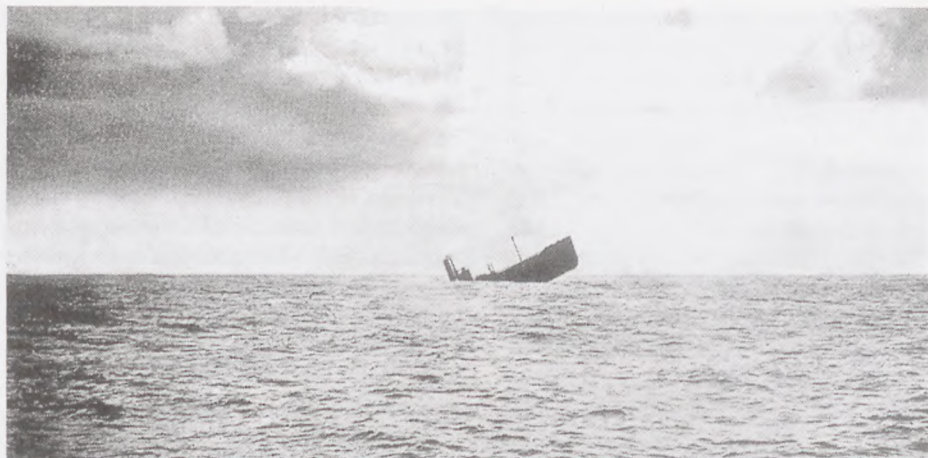
Endnu en ugerning fuldbragt.

Vi menige fra LEIESTEN blev kørt til Merchant Seamen's Club, en barak, der var blevet opført i anledning af krigen. Der blev vi indlogeret. Der var ikke logi at opdrive andre steder i byen. Der var nogle store sovesale med etagesenge, og i underste etage var en stor spisesal. Der kunne man