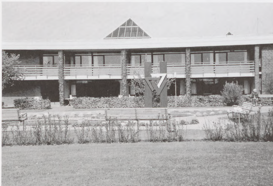
Bernadottegårdens springvand og fontæne foran blok 4.

For 5 år siden stiftede Bernadottegårdens bestyrelse en Beboerfond, som skulle hjælpe med til at forsøge livet lidt og gøre dagligdagen mere afvekslende for beboerne ved at give støtte til en udflugt, hjælp til et ålegilde for medlemmer af MF-klubben (de tidl. modstandsfolk og fanger), et