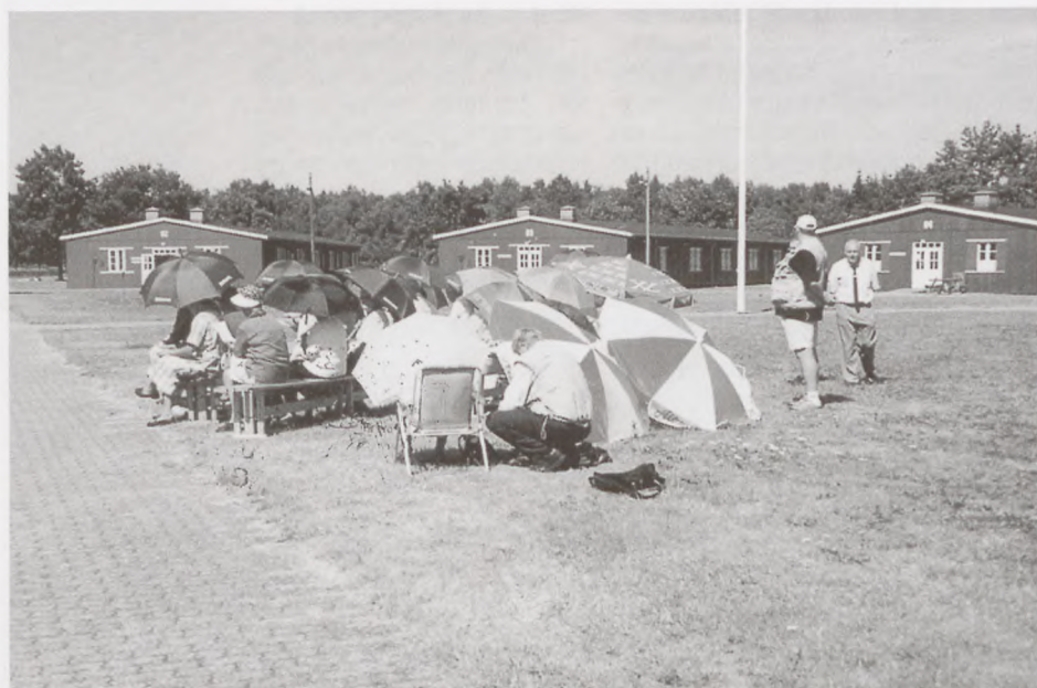
Billedet viser Frøslevlejrens Venners årstævne. Nogle kaldte det parasolstævne. Temperaturen var 30 C.