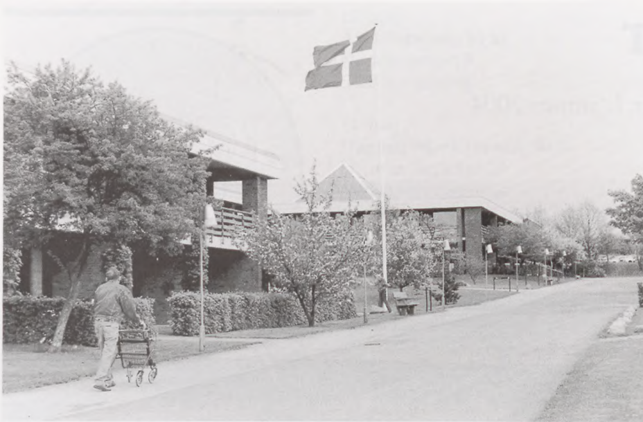
En del af Bernadottegården, med flagstang og »tit« til mindeegen.

gange om året bliver der udflugter. Disse arrangementer bliver støttet af Beboerfonden.