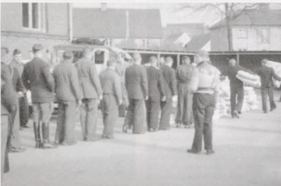
Fanger i skolegården i Frederiksværk. (Maj 1945).