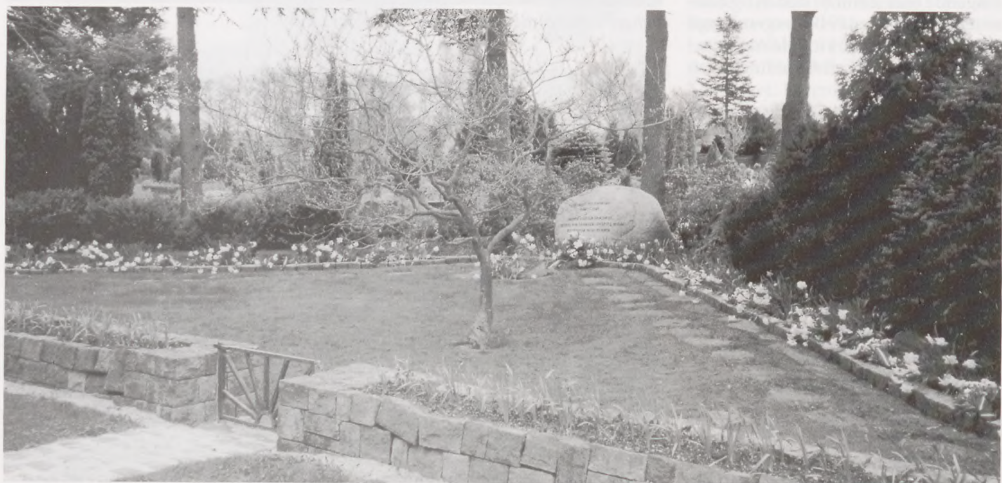
Begge fotos er fra Mindelunden på Nordre Kirkegård i Randers.