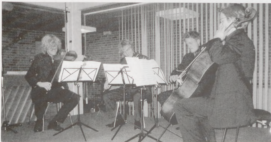
Den Unge Danske Strykekvartet.