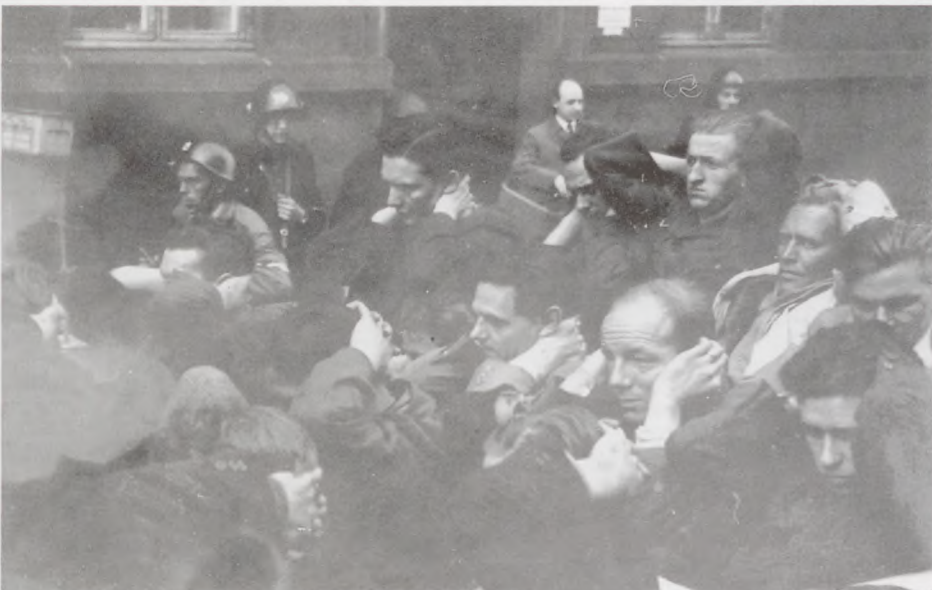
På vej til internering.