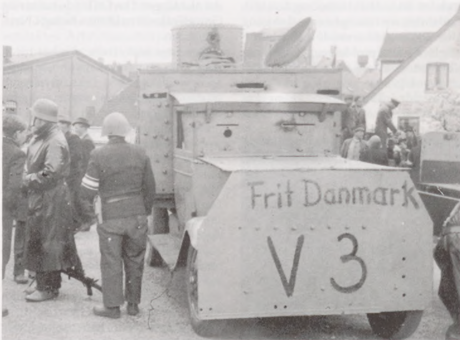
Bilen bakkede lige hen til sommerhuset i Asserbo, og da hipoerne trods gentagne opfordringer ikke ville overgive sig, fik de et par maskingeværssalver, hvorved tre blev dræbt og flere blev såret, i alt blev 17 anholdt. (Maj 1945).