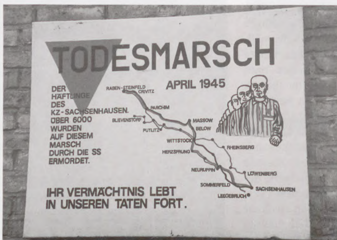
Dette foto taler sit eget – grusomme – sprog.