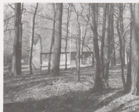
Museet i Belower Wald kaldet Todesmarschmuseum.

Åbent: 1. marts til 30. november: 9-16 (lukket mandag). 15. juni til 14. september: 9-17 (lukket weekend og mandag), 1. december til 28. februar: 9-16 (lukket i weekenden).