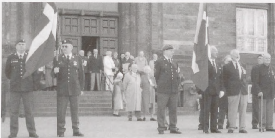
Københavns Rådhus 9. april 2004. 2 minutters stilhed kl. 12.00.

Nogle af deltagerne ved 9. april mindehøjtideligheden på Københavns Rådhus.