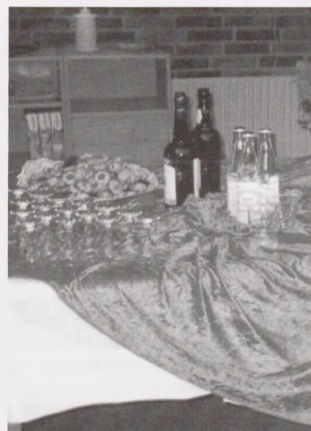
Det var bordet!