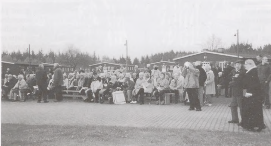
Billedet viser nogle få af de ca. 400 gæster.