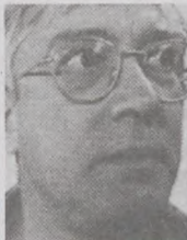
Af Steffen Dresler Vættehøjen 42 4700 Næstved

Kronikøren nævner »Operationsorder No. 1«, udstedt umiddelbart før D-dag, som grundlag for iværksættelse af ødelæggelsen af bl.a. de danske jernbaner ved hjælp af sabotage og en deraf mulig manglende allieret bombing. Men årsagen var slet og ret, at de allierede ganske simpelt ikke havde hverken fly eller besætninger til rådighed til at gennemføre angreb. Derfor var sabotage den eneste mulighed i Danmark. Luftstøttemæssigt var det oven i købet så galt, at man måtte anvende strategiske flyenheder i rollen som taktiske bombere for at ødelægge eller blødgøre mål i Frankrig lige efter D-dag. Dette gav så den tyske industri »luft« til at producere materiel samt for værnemagtens vedkommende at flytte enheder hen, hvor de skulle anvendes. Først sent i efteråret 1944 og foråret 1945 havde de allierede få, men egnede flytyper til rådighed for evt. angreb i Danmark, bl.a. RAF Mosquito bomber- og jagerbombere samt RAF Mustang III og IV jagere. Men kun meget højt prioriterede mål fik glæde af denne flykapacitet, og det