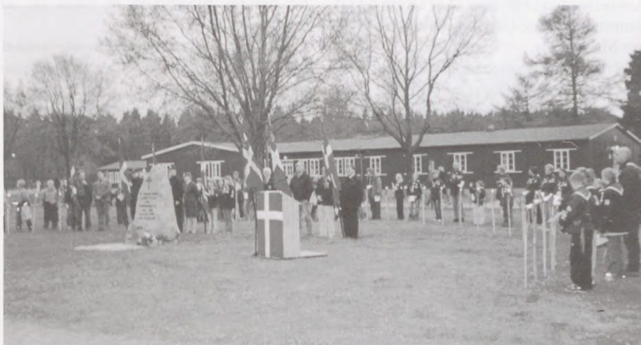
Da det er aften, er faklerne tændt. Vi ser mindestenen og talerstolen.