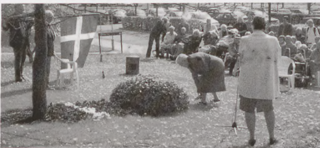
Der lægges blomster ved Bernadottes mindesten på Bernadottøgården.