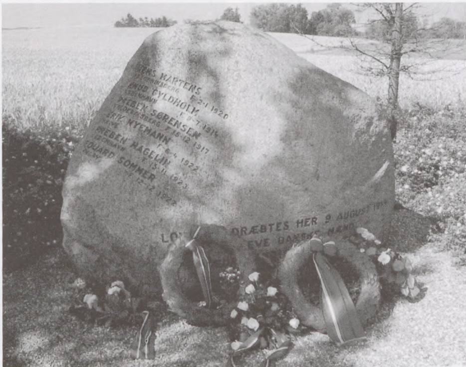
Denne smukke natursten med navnene på de dræbte og med de Erhvervshæmmedes krans. Kan det være mere højtideligt?

Vi samles, fordi det er vigtigt, at nutiden mødes med fortiden. De næste generationer må ikke glemme, hvad ondskab og krig kan føre med sig af overgreb, ligegyldighed og uret. .... Nutiden viser os, at ondskaben lurker under overfladen. I Irak ser vi eksempler på, at der også dér bliver begået uret mod den enkelte. Den samme angst og fortvivelse, som I, der var med den gang, oplevede, kan også ramme en ny generation. Men både historien og nutiden vidner om, at det gør en forskel at kæmpe mod uretten. Så mennesker kan omgås hinanden i næstekærlighed, respekt og venskab. Dette mod, at kæmpe for det gode, besad disse