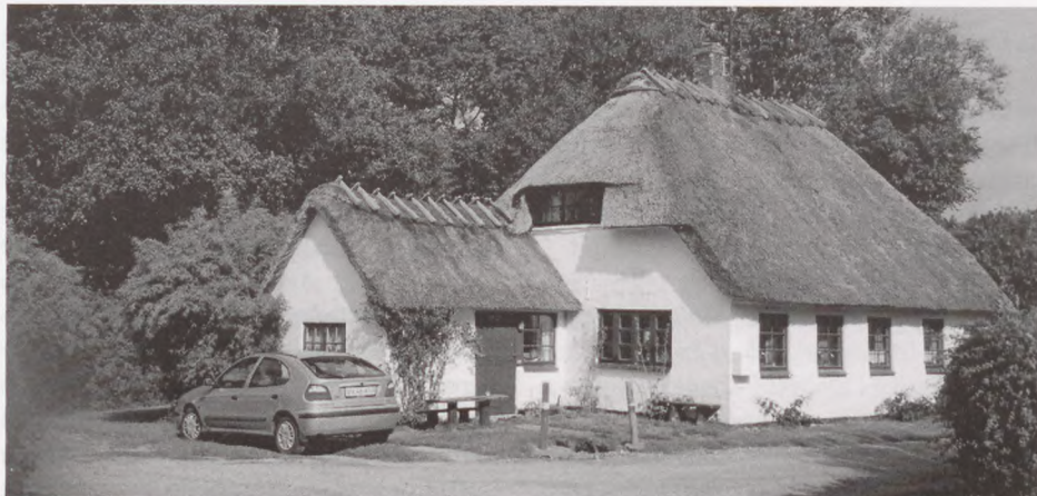
Kegnæshuset, det formentlig mest fotograferede hus i dette område.

Der findes ikke nogen samlet statistik over, hvor mange mennesker, der gennem årene har holdt ferie i Kegnæs-huset. Et skøn, der bygger på optegnelser fra 1980 til i dag, peger på, at der nok i alt har været omkring 10.000 brugere i perioden 1951-2004.