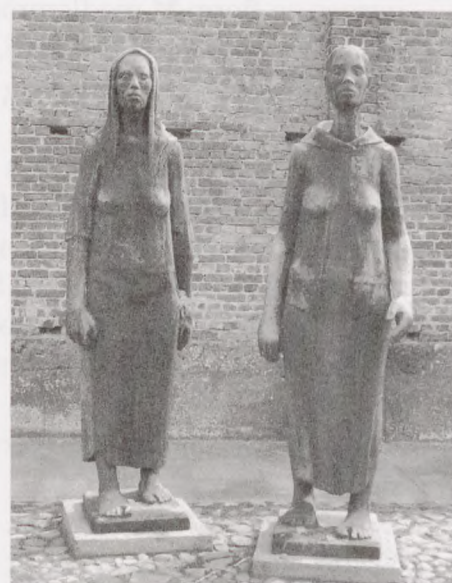
Disse to kvindefigurer fortæller vel alt om den fornedrelse kvinderne - og andre - var igennem i Ravensbrück.