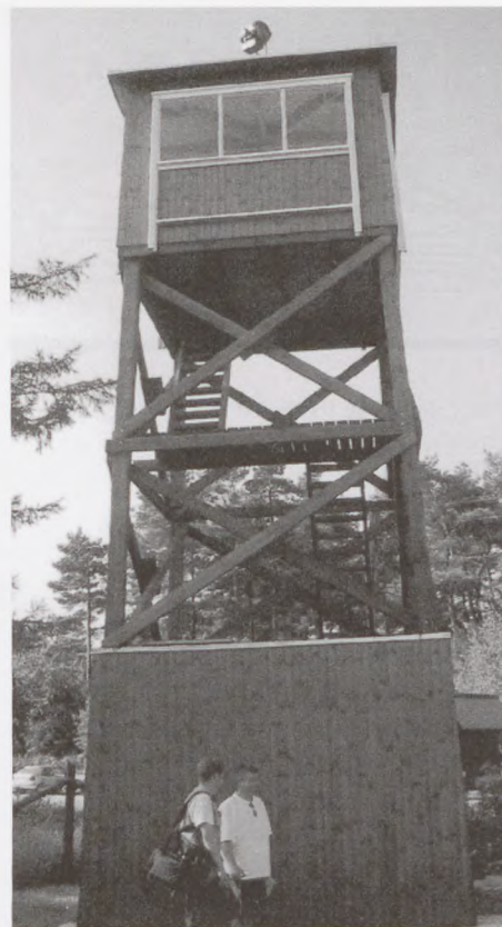
Det genrejste Tårn 5.

Søndag begyndte med flaghejsning og musiktime, hvor deltagerne fik rørt stemmebåndene, inden den årlige generalforsamling begyndte. Formanden be-