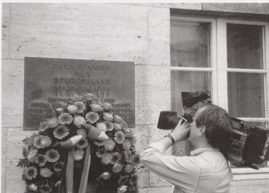
TV-fotograf filmer mindetavlen for de henrettede i Bendlerblock - på dagen smykket af forbundsregeringens krans i de tyske farver.

Ihukommende 60-året var der gjort ekstra meget ud af det i år - også af sikkerhedsforanstaltningerne med så mange prominente deltagere samlet på ét sted. Som pressemand blev man kontrolleret, først ved den forudgående akkreditering (godkendelse) hos regeringens pressekontor, så ved ankomsten til området og til sidst ved indgangen til selve Bendlerblock.