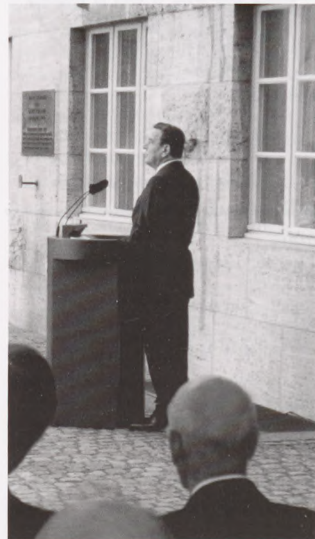
Forbundskansler Gerhard Schröder holdt mindetalen i Bendlerblock

Her bliver der hvert år den 20. juli holdt mindetaler, nedlagt krans og spillet sørgemusik.