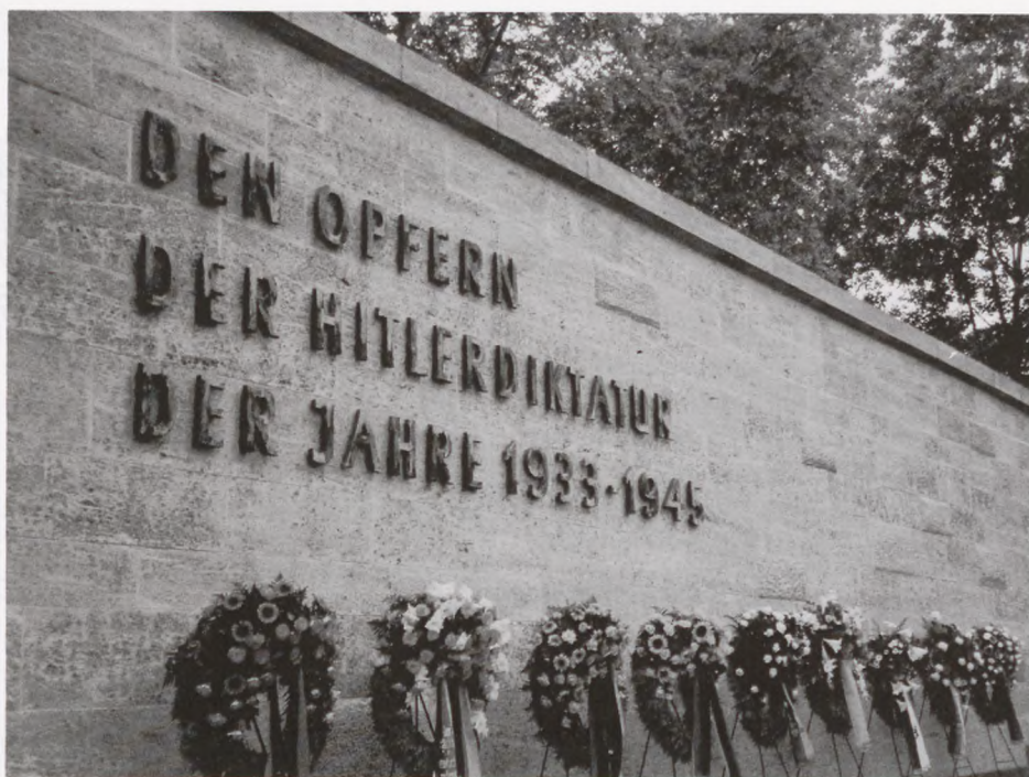
Mindemuren i Plötzensee med 60-års dagens mange kranser.

Men trods Stauffenbergs militære dygtighed og store mod, lykkedes attentatet heller ikke denne gang. En række