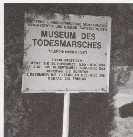
Få billeder kan undvære tekst. Her er et af dem!

En times kørsel mod NV fra Ravensbrück ligger der et lille interessant museum i Belower Wald. Da de russiske styrker i april nærmede sig Ravensbrück og Sachsenhausen, sendte SS'erne de mange tusinde fanger, ca. 35.000 fra Sachsenhausen og 15.000 fra Ravensbrück, ud på en døds-march mod NV. 40 km om dagen forlangte SS'erne af de udsultede og syge fanger, og kunne de ikke følge med, ventede døden på dem fra SS'ernes geværer. Efter et par døgn var 16.000 af dem nået til skoven ved Belower. Mens SS slog sig ned i den nærliggende landsby måtte fangerne klare sig i sko-