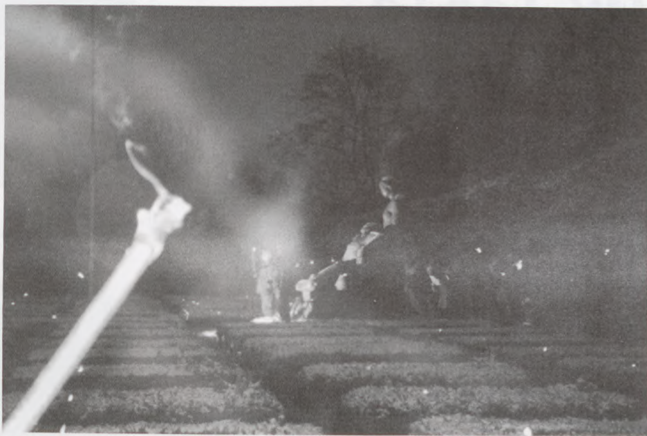
Monumentet juleaften 2004 i Mindelunden.

Det er efterhånden mange år siden. Der er vokset nye generationer frem i de over 60 år, der er gået. Mindet kommer med tiden til at fylde mere end savnet.