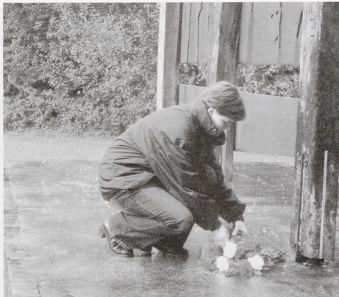
En anden deltager lægger en buket ved mindesmærket for bombardementet af fangeskibene i Neustadtbugten.

inden vi gik langs med mindemuren og så mindepladerne med navnene på alle de nationer, der havde haft fanger i lejren. Der blev lagt en buket først ved Danmarksstenen og senere én ved monumentet for Muselmanen. Skulpturen med den nøgne, udhungrede og fornedrede kz-fange.