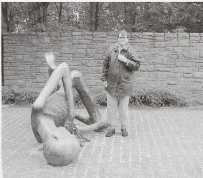
En af deltagerne lægger en buket ved Muselmanen i Neuengamme.