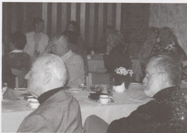
Nogle af de mange tilhørere ved Auschwitz-dagen den 27.1.05.

Omtalte det primitive i mennesker, hvordan han en juleaften i 1944 forsvarede deres Røde Kors-pakker med læ-