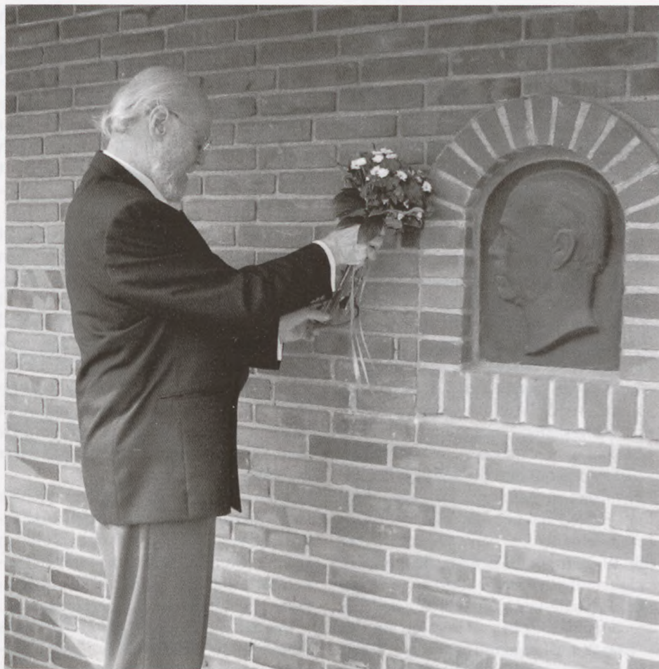
5. maj indledes med at sætte blomster ved Folke Bernadottes relief. 5. maj 2004.