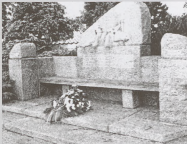
Foreningen Gestapofanger fra Randers havde lagt en krans ved monumentet i Hornslet.