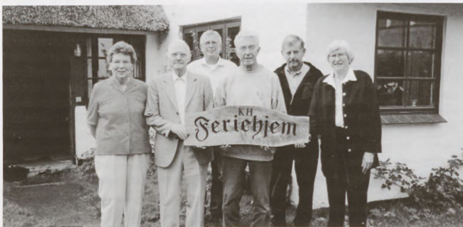
Kegnæshuset. Medlemmer af bestyrelsen på besøg i 2001.

Nutiden har andre problemer og det er svært for de hjemvendte fanger at tale med den næste generation, måske specielt egne børn. Her kan et andet initiativ, 4. Maj Kollegierne over hele landet, være med til at formidle den fortsatte kontakt.