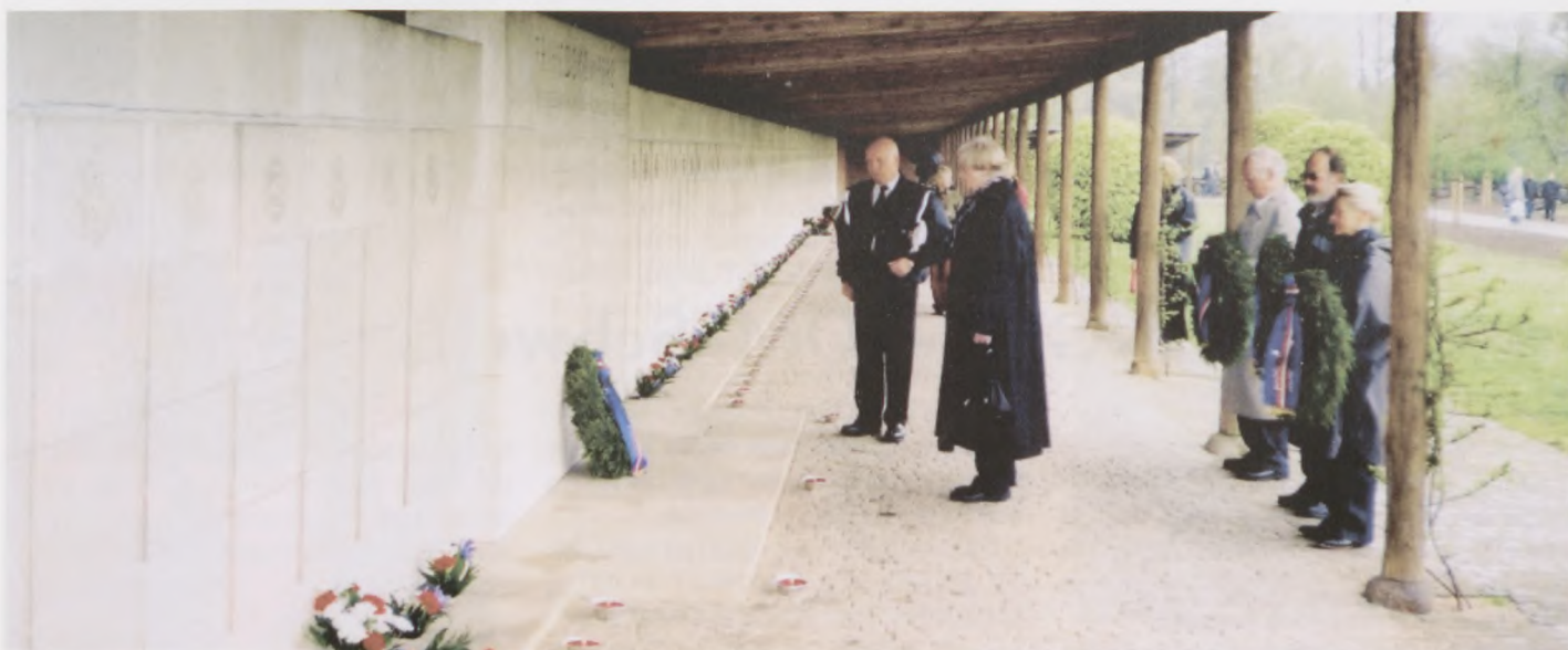
Der lægges krans ved mindevæggen.