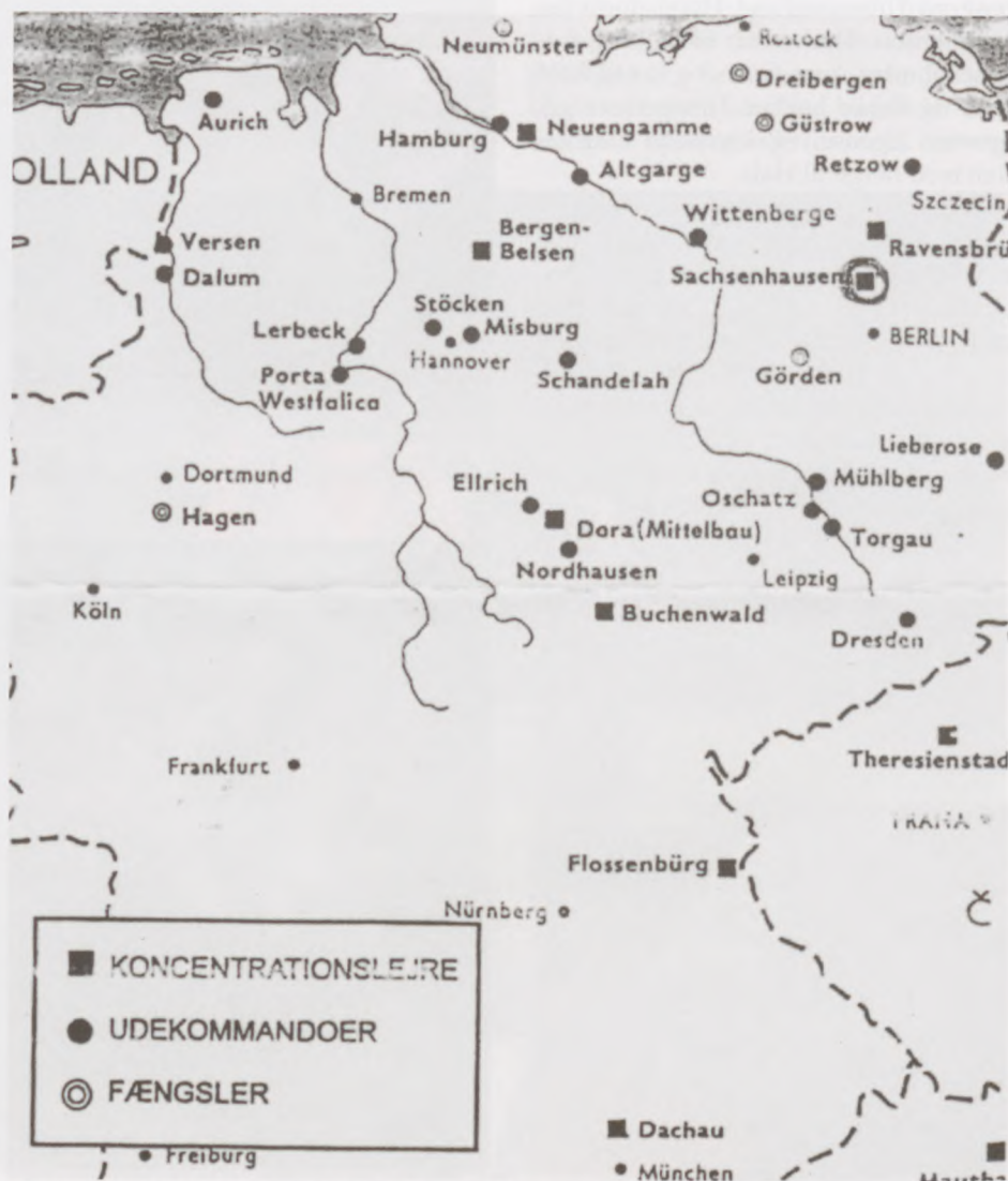
Kort over udelejrre og arbejdslejrre tilknyttet Neuengamme KZ-lejr.