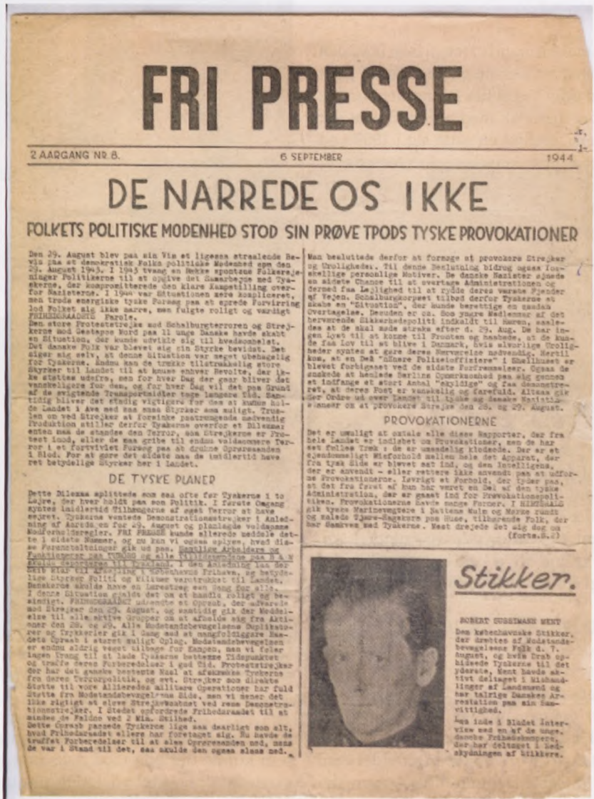
Uddrag fra det illegale blad "Fri Presse" 6. september 1944, der fortæller om befolkningens modenhed i kamp mod de tyske provokationer den 29. august 1943.

Det syntes de oprigtig talt lykkedes ganske godt, når vi holder os til Danmark, uden at de er tilfredse med alt, hvad der sker. Alligevel mener de, det går så rimeligt, at de har kunnet tillade sig at koncentrere sig om truede områder, som f. eks. Efterkrigsgenerationen i Tyskland, og så kommer I minsandten og snakker om, at de er nationalister i forhold til jer.