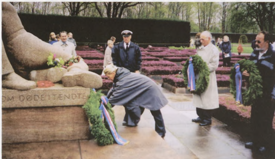
Kammeraternes Hjælpefond lagde krans i Mindelunden i anledning af 60 året for befrielsen.