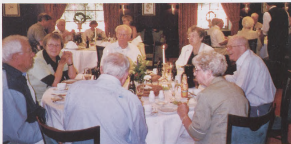
De glade delegerede og gæster ved frokosten

få en redaktør, Claus Arboe-Rasmussen, som kunne tiltræde med det samme, så vi nåede at få bladet ud, inden afholdelse af landsmødet.