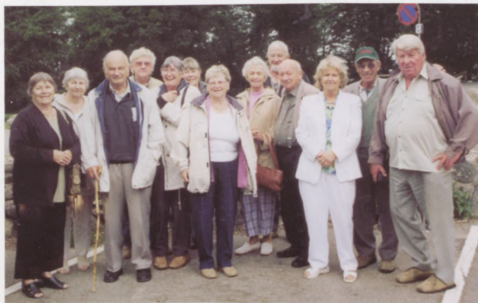
Udsnit af deltagerne.