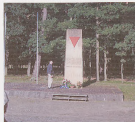
Viggo Stærmosen lagde en krans ved Belower Wald