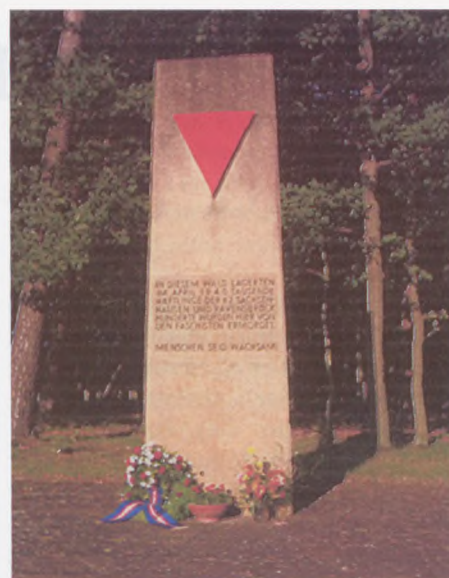
Beloewer Wald monumentet

Efter at de omliggende kredse i Jylland har fundet det nødvendigt at stoppe aktiviteterne, har heldigvis flere fra Aarhus og Grindsted fundet vej til Sydøstjysk afdeling.