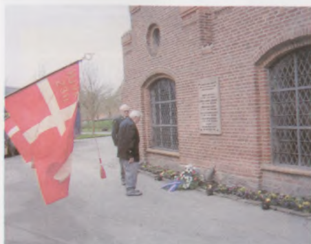
Mindelunden på Nordre Kirkegård