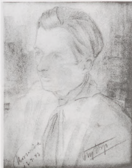
Tegningen er udført af maleren Nythrop, der var en af de første der døde i Stutthof.

Betydeligt langsommere gik det at genvinde kræfterne. Og nu må jeg indskyde, at jeg overhovedet ikke var klar over, at