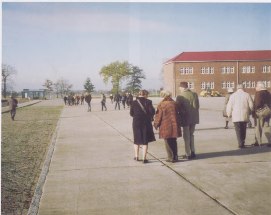
Kongresdeltagere på vej over appelpladsen sætter dens størrelse i perspektiv.

Arbeitsgemeinschaft Neuengamme, der er den nationale tyske organisation, var retog på udmærket måde de praktiske arrangementer. På dagsordenen drøftede og vurderede man de store foranstaltninger i maj 2005, der var præget af at de alene var gennemført af Hamborg Senat og ikke som tidligere i samarbejde med AIN. Der blev bla. kritiseret, at Senatet ud over at have betalt opholdsudgifter for tidligere fanger ikke havde tilbudt det samme for efterladte pårørende. Flere, bla. de danske, fandt dog at det var en stor gestus at Hamborg havde betalt tre døgn's hoteludgifter for over 900 tidligere fanger.