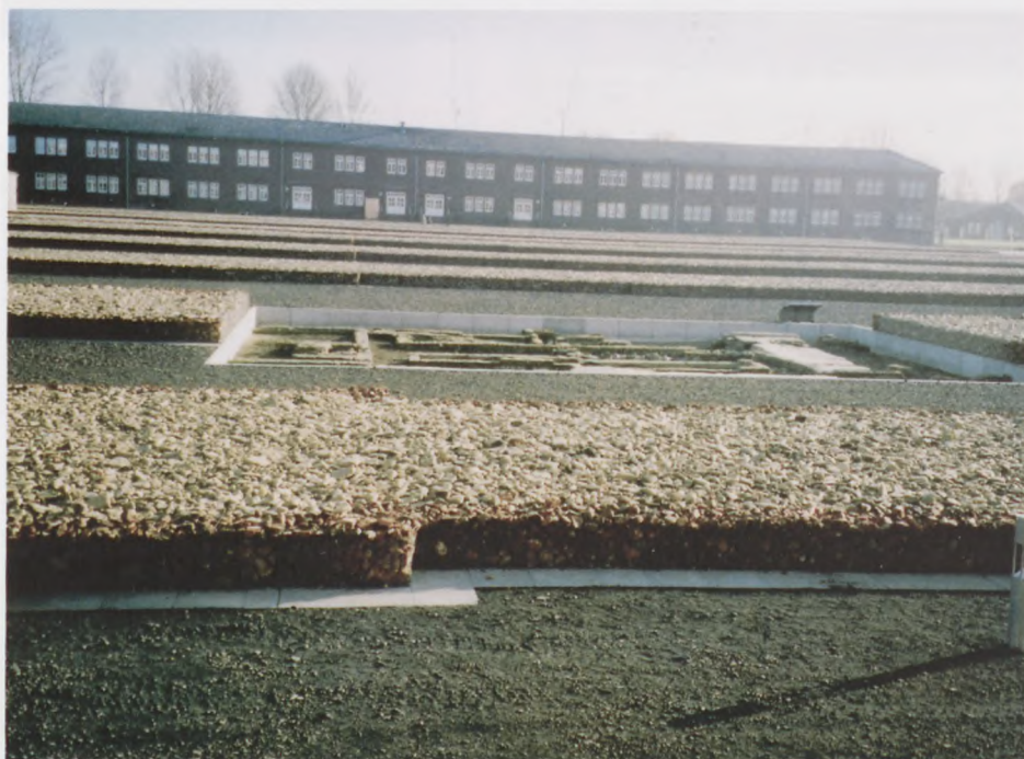
De frilagte fundamenter fra vaske- og latrinarealet giver et rystende indtryk af, hvor små disse rum var med 500 fanger i hver blok.

Det blev kritiseret, at de udvendige anlæg ikke på terrænbelægningerne gav mulighed for kørestolskørsel, selvom der var både udvendige og indvendige elevatorer fra terræn til begge store stenbygninger (blok 1-4 og 21-24). De næste to dage kunne man dog konstatere, at man var i fuld gang med at etablere flise-stier beregnet til kørestole. Den nye stiliserede indgangsbygning er dog fejlkonstrueret til det barske og fugtige Neuengammeklima, så den bliver bygget om. Vi så også, at man i blokkene 7-8