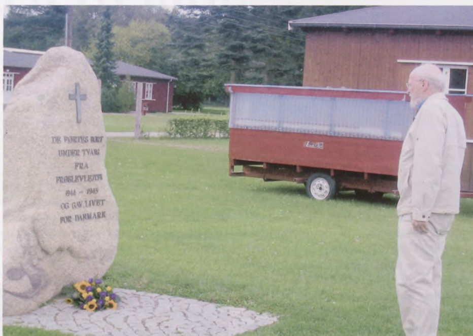
MHN har lagt en buket i Frøslev

De førtes bort under tvang Fra Frøslevlejren 1944-1945 Og gav livet for Danmark