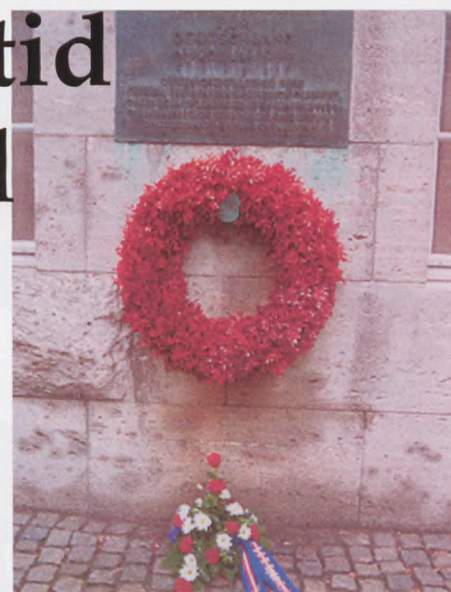
Mindetavlen i Bendlerblock Berlin

Så kørte vi til Belower Wald Mindelunden for døds-marchen. Da vi kom til museet i smukt solskin havde tre søde damer til vor overraskelse dækket et langt bord i haven, hvor vi fik kaffe og kage. På Døds-marchen tvang SS-fangerne 33.000-35.000 fra Sachsenhausen og