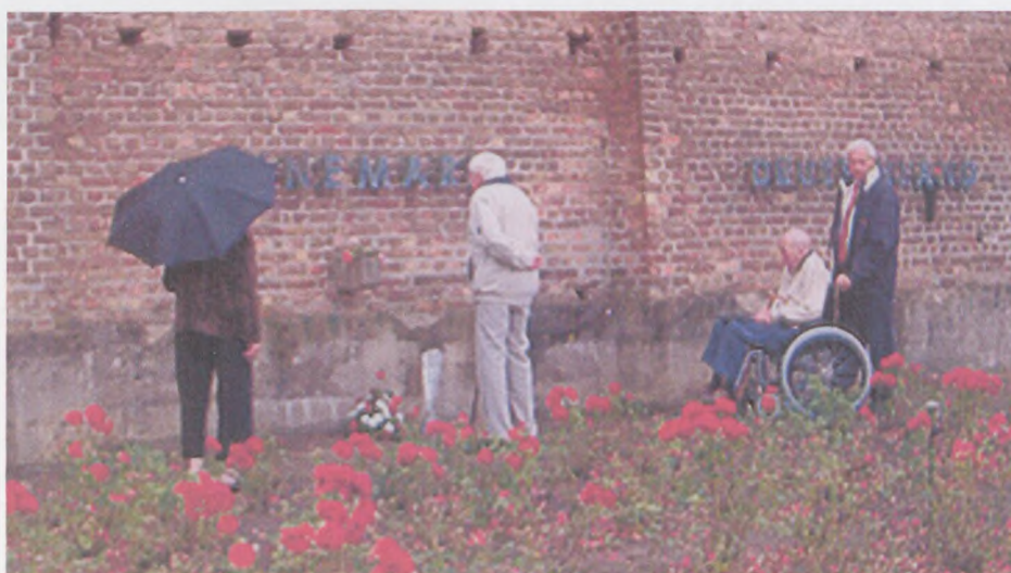
Ved Danmarks muren i Ravensbrück.