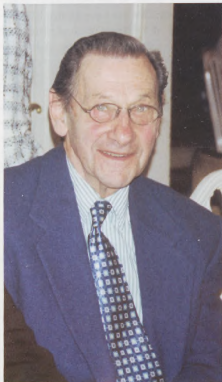
Salle Fischermann, foreningens kasserer