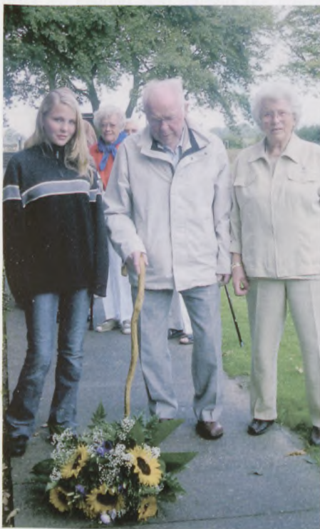
Louise og farfar har lagt en buket i Neuengamme ved Danmarksstenen i overværelse af farmor.

Den medbragte frokost blev indtaget i bussen, inden vi tog på en havnerundfart i Hamburg, som omfatter en af Europas største havne med værfter, som "Blom und Voss", hvor man bl.a. byggede U-både, her omkom mange polske fanger under det umenneskelige hårde arbejde. Vi kom forbi kæmpestore fragt-