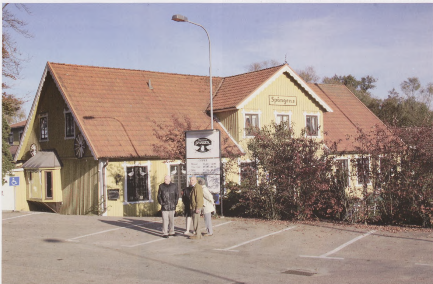
Gästgivergården Spången i Ljungbyhed.