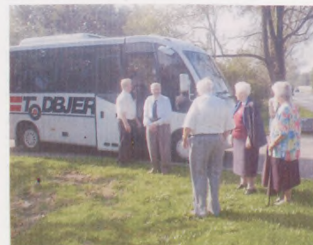
Turen til Hjarbæk Kro og Himmelbjerget