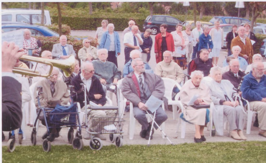
Nogle af deltagerne ved Bernadottegårdens 30 års fødselsdag den 29. august

Mens blomsterne blev lagt spillede en trompetist fra Hjemmeværnets musikkorps Køge: "The Last Post".