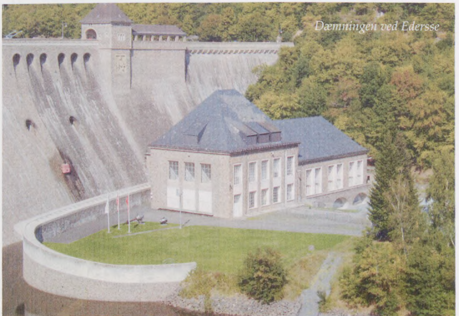
Dæmningen ved Edersse