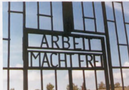
Arbeit macht frei. Indgangsportalen til Sachsenhausen kz-lejr.