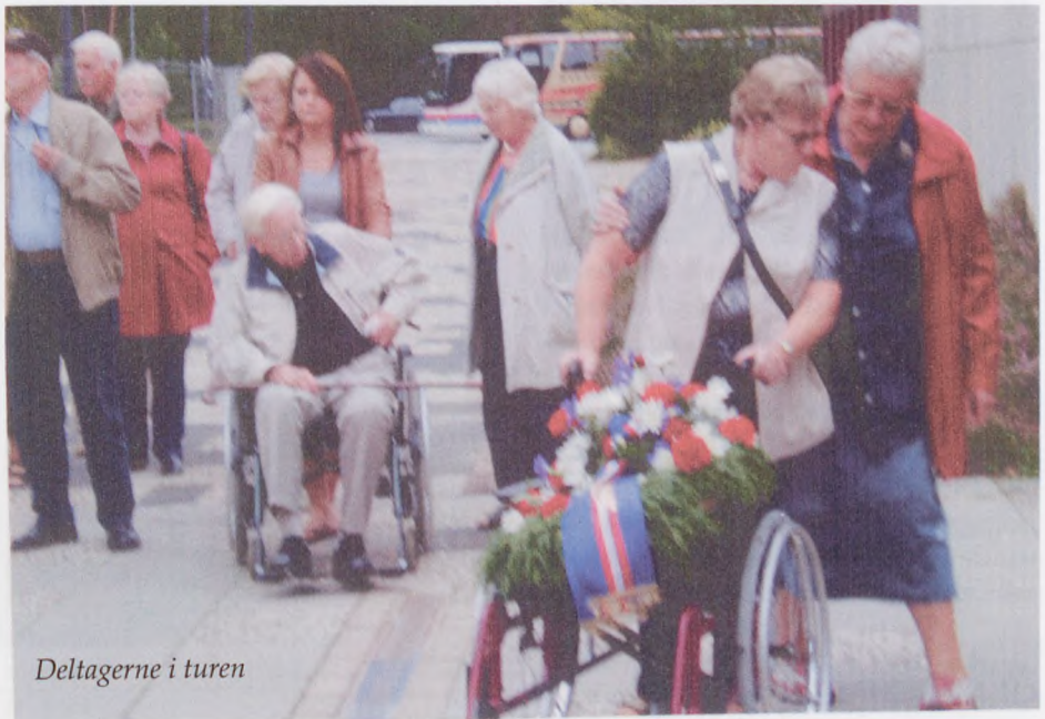
Deltagerne i turen