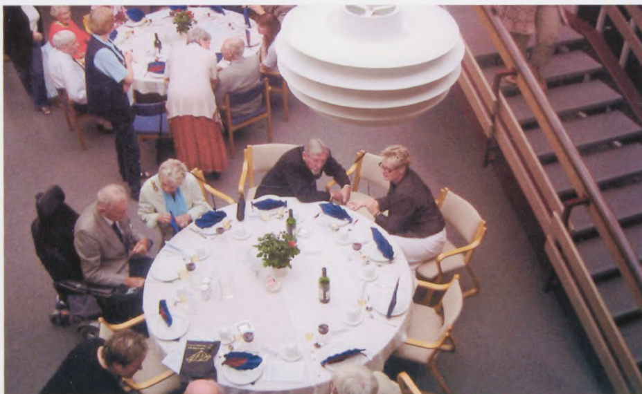
De festligt dækkede borde