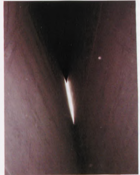
Holocausttårnet, hvor lyset kommer ind fra toppen

Tirsdag morgen kl. 9.00 sad vi i bussen, og kursen blev sat mod Berlin, hvor vi skulle se det Jødiske museum. Museet er tegnet af den kendte arkitekt Daniel Libeskind. Bygningen er meget speciel – det er et stort museum, bygget sammen med gammelt og nyt. Den nye del af museet er bemærkelsesværdigt – dels på grund af arkitekturen, der nærmest kan sammenlignes med en tordenkile – dels på grund af underetagens "tomme rum". Linien, der går igennem de