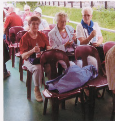
Deltagerne nyder sejlturen på floden Spree

Onsdag morgen var vi igen på vej. Turens første mål var KZ-lejren Ravensbrück, som ligger ca. 1 times kørsel