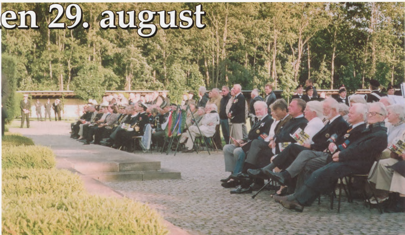
Vuê over de indbudte gæster.