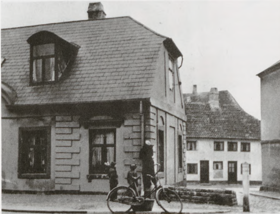
Svingelport 6 i Helsingør. Børnene studerer skudhullerne.

Chokket i Helsingør over dette clearingmord var stort, og den dag da Otto Bülow skulle begraves var der 5000 i og udenfor Helsingør kirke til at følge Otto Bülow det sidste stykke vej, og de næste 14 dage var der generalstrejke både på grund af mordet men også på grund af besættelsen.