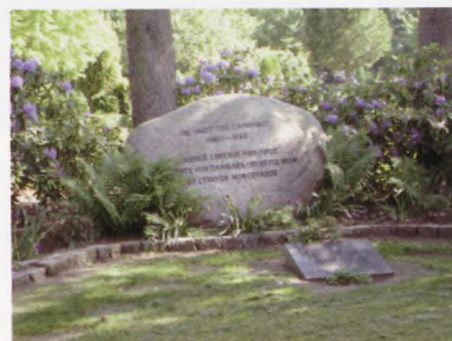
Mindelunden Ndr. Kirkegård Randers