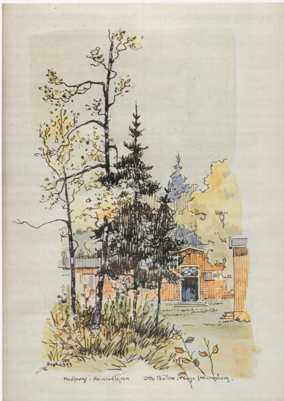
Otto Bülows tegning fra 1943.

Otto Bülow blev løsladt fra Horserødlejren 4. oktober 1943, og han kunne dermed komme hjem til sit atelier og