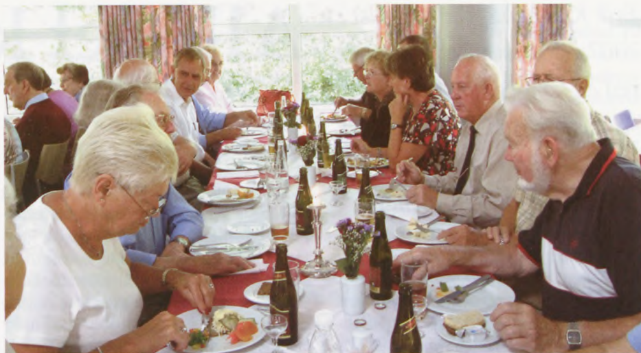
Snakken gik ivrigt ved frokostbordet.

Hein og mange flere. Et stort indtryk gjorde sangen, der blev udødeliggjort af Lulu Ziegler: "Den sidste turist i Europa".