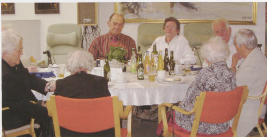
Billede fra Grundlovsfesten der blev omtalt i formandens beretning.