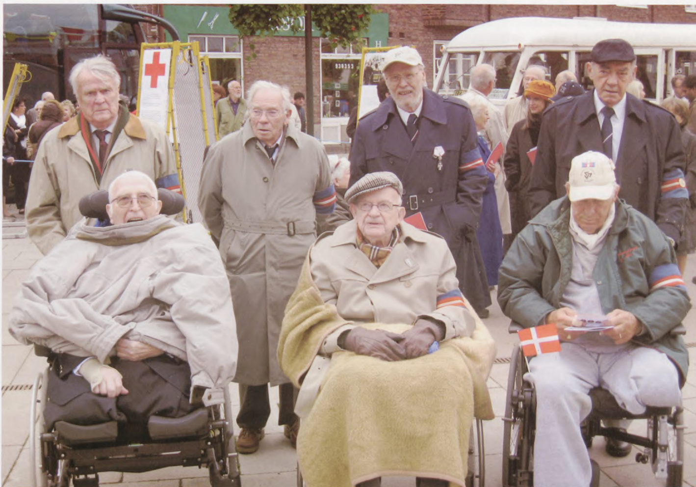
Deltagerne fra Bernadottegården i Roskilde