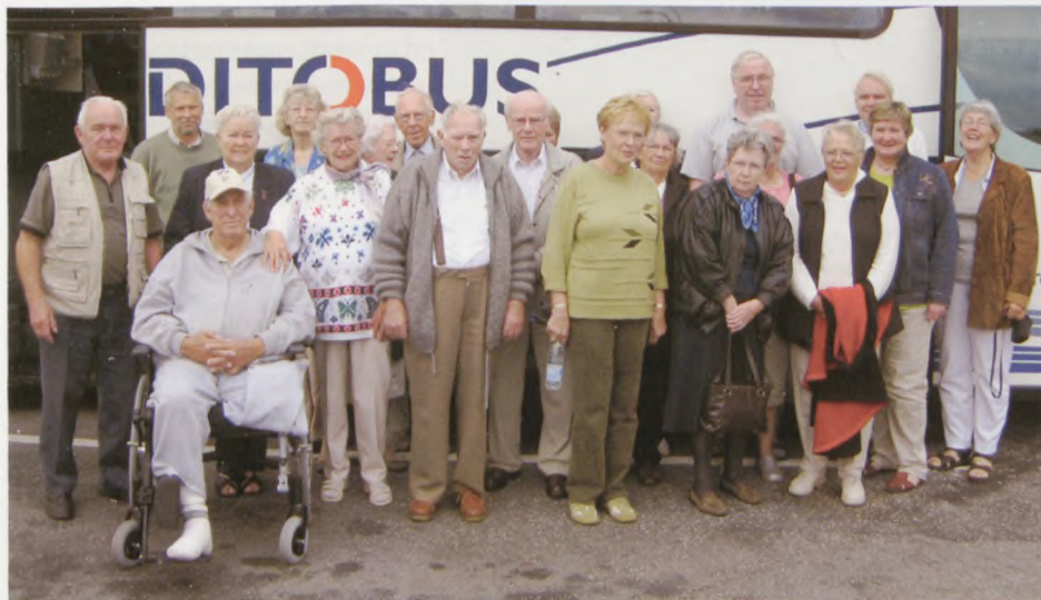
Alle rejsedeltagerne 3. september.

Dalum var ligeledes en rigtig hård lejr. Fangerne arbejdede med træfældning og lavede bl.a. pansergrave og faskiner. I denne lejr var dødeligheden ligeledes stor, og flere danske kom ikke kom med hjem.