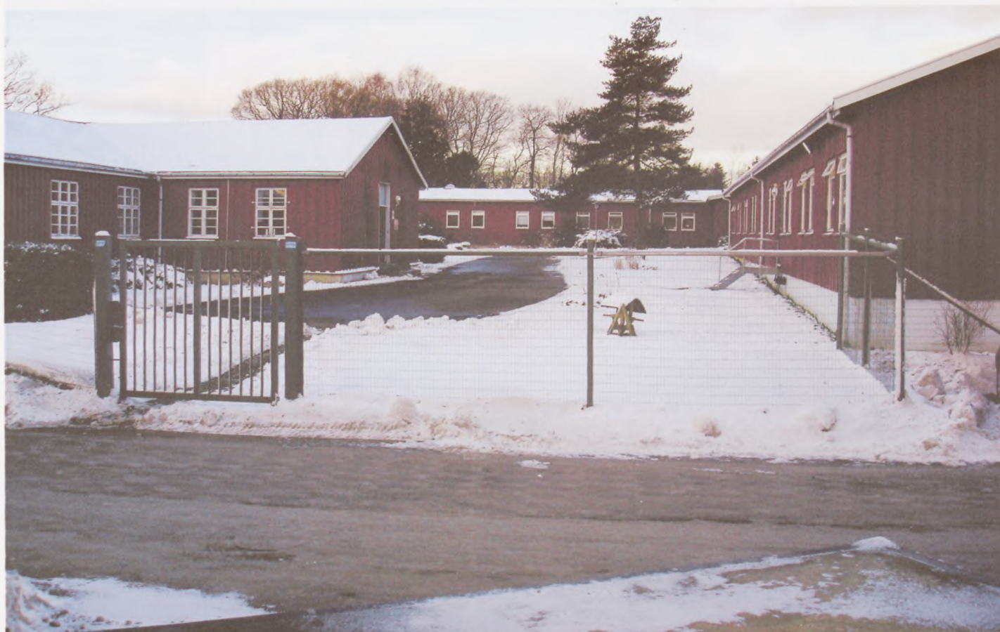
"Jødelejren" – som den ser ud 2007. Bagerst ses barak 19, til højre barak 20 og til venstre barak 21.