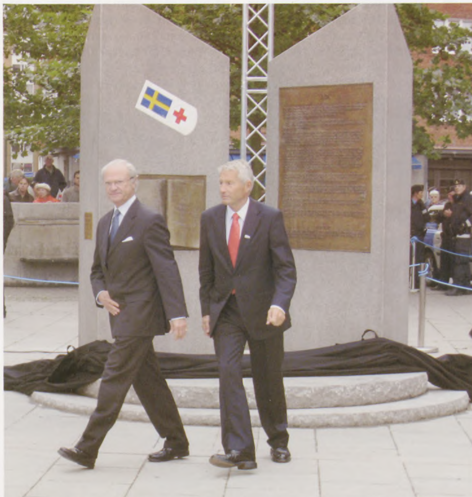
Monumentet blev afsløret af Hans Majestæt Kongen.