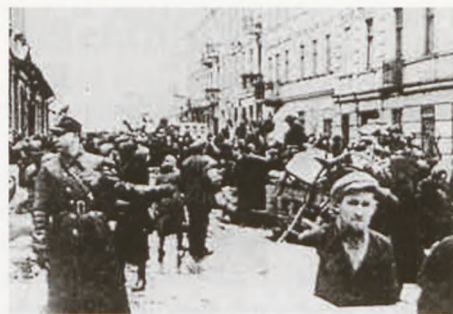
Lodz-jøder drives fra deres hjem ind i ghettoen.

Pludselig, og fuldstændig uventet, blev vi evakueret den 29. august 1944. I huj og hast blev alting pakket igen. Vi blev læsset ind i sporvogne, som kørte direkte til jernbanestationen. På den måde kom vi igennem byen Lodz for første gang. Jeg havde indtil da kun set den del af byen, der blev brugt som