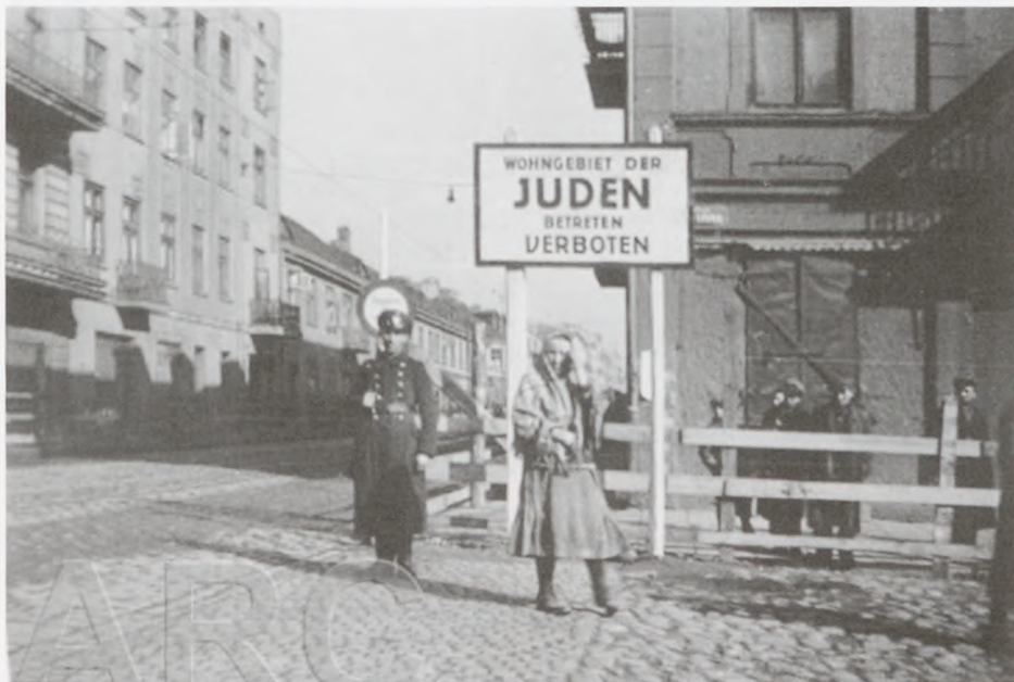
Kontrolpost ved indgangen til ghettoen i Lodz.