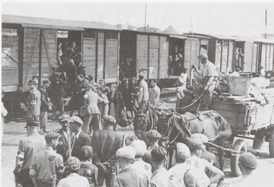
Jøder sendes med toget til Chelmnno.