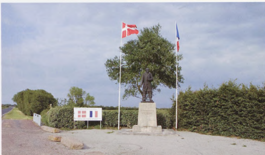
Mindesmærket i Normandiet med Dannebrog og det franske flag

128 af de 245 skibe blev sænket under krigen, og 962 af de 6300 søfarende på udeflåden kom heller ikke hjem. Søfolkene var den befolkningsgruppe, der led de største tab, i alt omkom 2341 danske søfarende under krigen. Over 100 var endnu ikke fyldt 17 år, de levede som drenge, men døde som mænd. Allerede før den 9. april 1940 var 29 forsvarelseløse danske skibe blevet torpede-