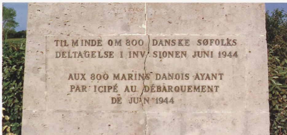
Inskriptionen på mindesmærket i Normandiet, bemærk revnerne.

samlingen tilvejebragte halvdelen af de 500.000 kr., der skulle bruges.