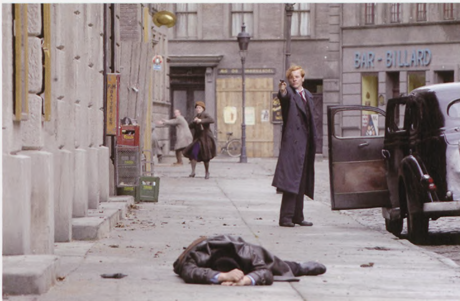
Spillefilmen "Flammen & Citronen" har gjort de to veteraner fra HD's likvideringsarbejde berømte både herhjemme og i udlandet. Begge var stærkt eftersøgt af tyskerne og mistede livet med kort mellemrum i efteråret 1944.

Grupperne i HD var i august 44 samlet i 9 faste afdelinger med over 200 mand. Sabotagen lå nærmest stille og likvida-