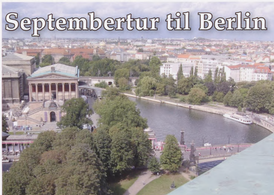
Udsigt over Berlin, taget fra toppen af Berlins Domkirke.

Foreningen gennemførte i september 2008 en meget vellykket bustur til Stutthof (modstandskampen dec. 2008) for 23 af foreningens medlemmer.