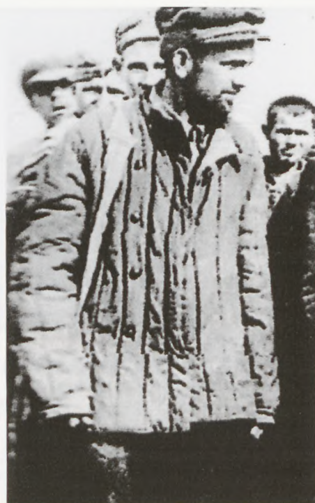
Sådan så mit russiske "arvestykke" ud 15. nov. 1944 i KZ Versen.

Efter ankomsten til vores arbejdsplads var den første kommando, trods