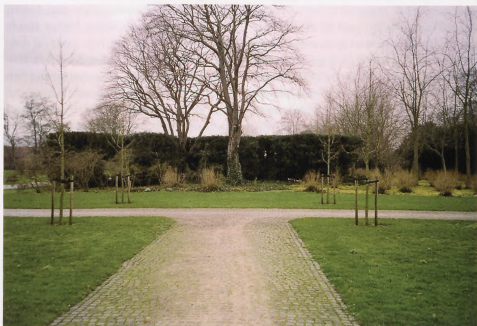
Formidlingshuset kan også tænkes placeret foran pergolaen på plænen, der ligger ind mod gravfeltet.

Vi håber at alle gode kræfter vil bakke op om vores ideer, så planerne kan realiseres i den nærmeste fremtid.