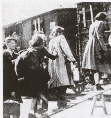
Jøder fra Lodz-ghettoen begynder den sidste rejse til Chelmo ydryddelseslejren.

Da det er blevet helt mørkt, forlader vi vort skjulested. Vi opfatter mørket som en stor hjælp. Forsigtigt går vi videre, og til sidst kommer vi til en landsby. Forsigtigt, på trods af mørket, og bange for at blive afsløret, lister vi gennem byen. Vi er som altid sultne, meget sultne. Vi har ikke fået noget at spise siden i går morges, og vi er dødt trætte. Forsigtigt og sky banker vi på døren til den første gård, og beder om at få anvist en plads, hvor vi kan sove om natten. Lige nu betyder det mere for os end mad. Men desværre afslår de. Det er nu bælgmørkt, og de synes at være bange for os. Vi får i stedet en tallerken mad og to skeer. Jeg tror, det var mosede kartofler blandet med brød. Aldrig før i mit liv, og aldrig senere, vil noget smage mig så godt som dette