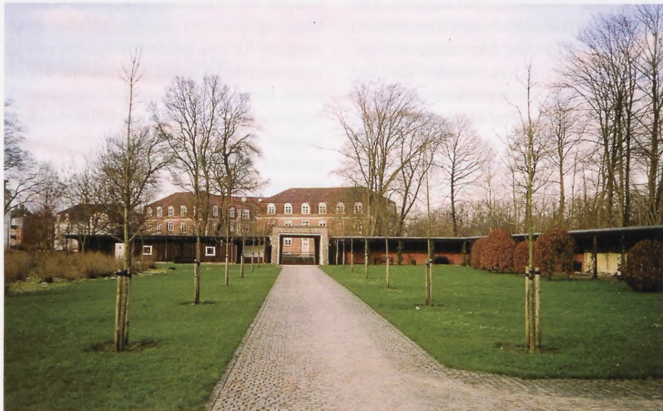
Her ses indgangen til Mindelunden inde fra, og formidlingshuset kan tænkes placeret til venstre, som en forlængelse af den eksisterende administrationsbygning.

navnene på stenene i Mindelunden, og hvorfor de er endt her.