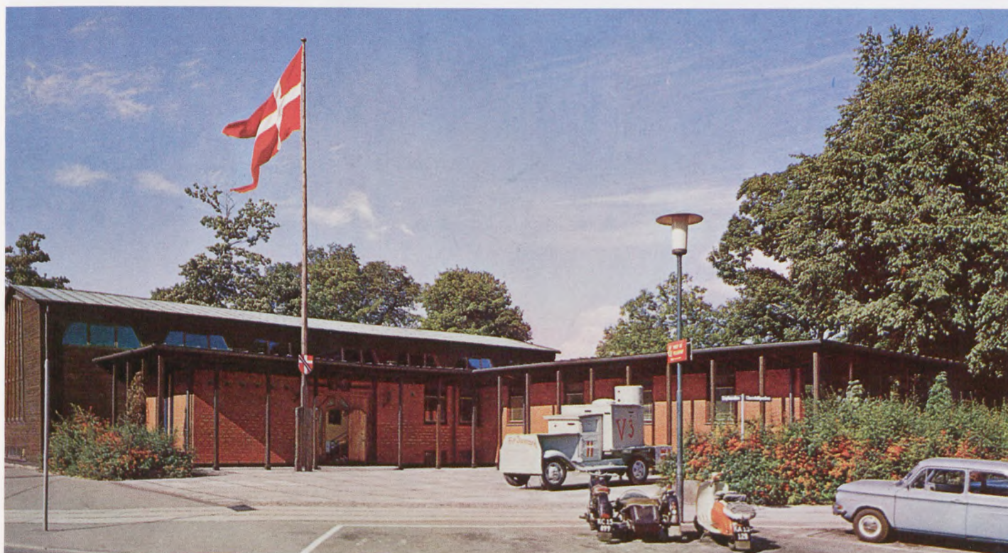
Frihedsmuseet – her i lidt yngre udgave.

Databasen har også nydt offentlig bevågenhed. Kulturministeriet og tipsmidlerne har således bevilget én mio. kr. til projektets gennemførelse. Det bliver det nærmeste man kan komme til en fuldstændig fortegnelse over modstandsbevægelsens medlemmer. På indvielsesdagen 4. maj var der ca. 30.000 navne i basen, men man regner med, at den kommer til omfatte over 70.000 mennesker. Tallet virker stort, de fleste kilder anfører antallet af frihedskæmpere ved befrielsen til at være ca. 40.000. Men med i dette tal er bl.a. ikke faldne, fanger hos tyskerne, Brigaden m.fl.