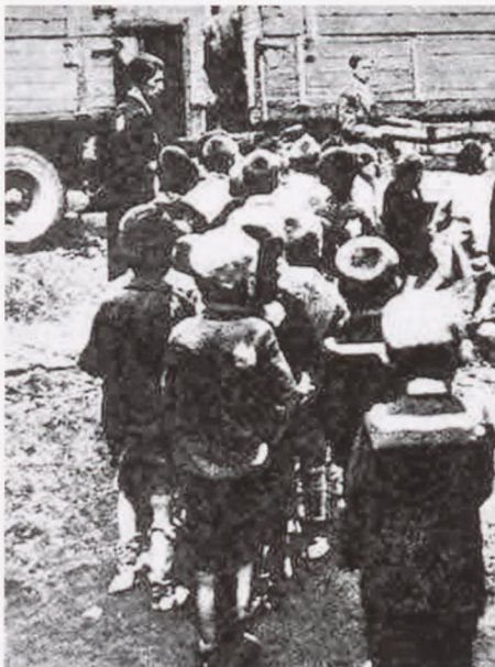
Forældreløse børn fra Lodz-ghettoen sendes til Chelmno udryddelseslejren.