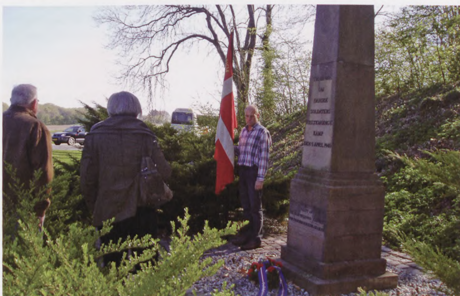
Ved mindestenen i Søgaardlejren.

Alle deltagere takker rigtig mange gange for en god og vel tilrettelagt tur.