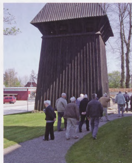
Det gamle klokketårn ved Kiplev kirke.