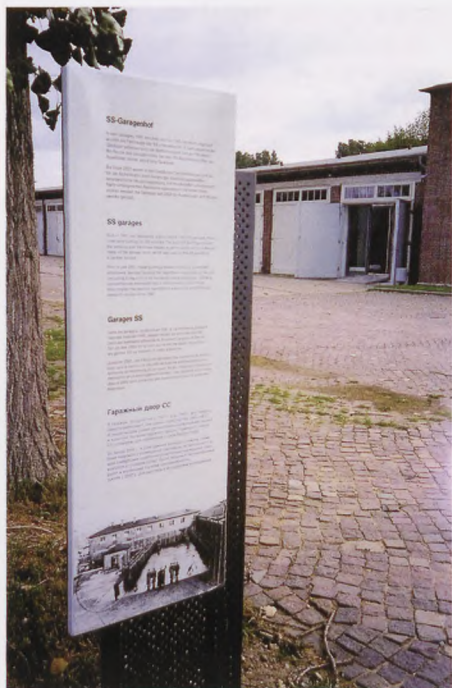
Her ser et eksempel på en informationstavle i KZ Neuengamme, hvor der på fire sprog er en beskrivelse af det objekt, der ligger bagved tavlen og der er et foto af, hvordan stedet har set ud under nazistyrret

I dag er mange besøgende 2., 3. og 4. generation efter de, der har oplevet Besættelsen. Mange kender meget lidt til 2. Verdenskrig og Besættelsen og kan ikke forholde sig til stedet. Når man kommer ind i anlægget ser man, ud over det flotte anlæg, en masse navne og årstal; men ikke meget om hvem det er, og hvorfor de er nævnt her.