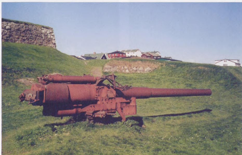
En af de engelske skibsskanoner opstillet ved Thorshavns gamle fæstning "Skansen" for at forsvare indsejlingen.