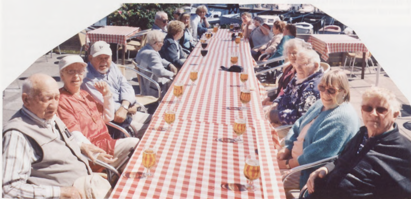
Ballen Havn, som man kan se er vi klar til frokost. Vejret fint, 23°.