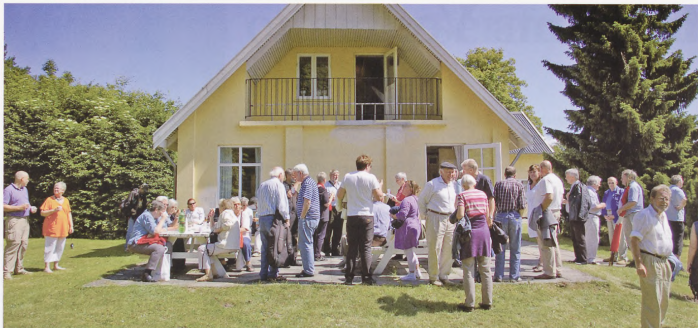
Deltagerne hyggede sig i det gode sommervejr.