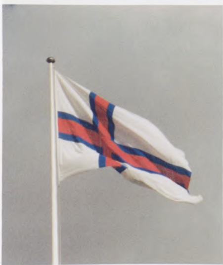
Færøernes flag "Merkið" blev indført under den britiske besættelse, før var det Dannebrog.

Dette perspektiv og dets betydning for øerne, deres befolkning og det britiske krigsførelse er i dag et ret ukendt