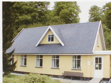
Horserødlejrens Museum.

"Jeg er glad for, at det netop er denne forening, som har gjort mig til æresmedlem. Horserød Museum indeholder blandt andet en historisk oversigt om krigsårene, som det er godt at bevare. Og Museumsvennerne kan ved sin støtte få stor betydning for museets fremtid. Interessen for hvad der skete i årene 1940-45 er vokset. Måske skyldes det, at det der sker i dag har en vis lighed med hvad der skete i 1930- og 40'erne. For at undgå at historien gentager sig, er det godt at kende sin historie. Vi skal være tolerante og bedre til at kommunikere, det var racisme og