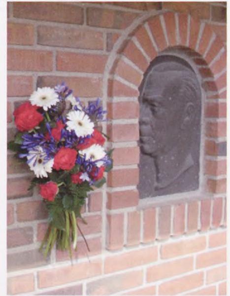
Blomster ved relieffet af Folke Bernadotte hører med til traditionen.