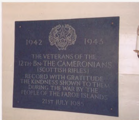
En britisk mindeplade i Thorshavns domkirke takker færingerne for deres "kindness" under besættelsen.

Straks efter ankomsten i 1940 besatte briterne den gamle fæstning "Skansen" i Thorshavn med udsigt over indsejlingen til byen. Den blev straks forstærket og udstyret med kraftige krigsskibskanoner, der står der endnu som lidt rustne krigsminder og turistseværdigheder. Der var ingen flyveplads på Færøerne, men i 1942 besluttede Churchill, at der skulle anlægges en lufthavn på Vaagø (Vágar). I dag er den en moderne lufthavn og hjemsted for "Atlantic Airways", Færøernes nationale luftfartselskab. Anlægget af den første lufthavn gav anledning til en invasion af RAF og bygningsarbejdere, så antallet af tilreisende briter kom op på over 8.000 – øernes befolkning var dengang på ca. 25.000. Så der blev ekstra gang i