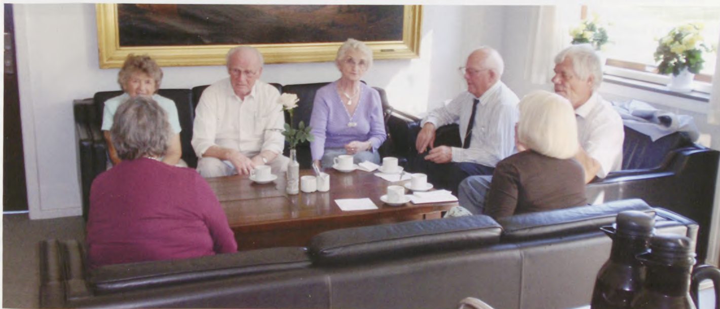
Hyggeligt samvær over kaffen i officersmessen på Ryes Kaserne.

Efterfølgende blev det vedtaget, at kontingentet til Landsforeningen hæves fra 25 til 75 kr.