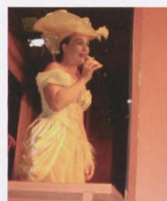
Underholdning i Bakkens Hvile.

fulde kvinder udenfor "Bakkens Hvile" og ventede på at blive lukket ind. Der blev grinet og sunget og klappet, mens vi nød de dygtige og professionelle sangerinder, der underholdt os i 3