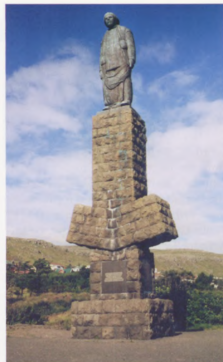
Mindesmærket i Thorshavn for øernes over 200 fiskere og søfolk omkommet under Anden Verdenskrig.

et møde mellem det britiske verdensrige og den ret isolerede danske "koloni". Det skabte i efterkrigstiden nye politiske holdninger og strømninger i befolkningen og tanker om hel eller delvis selvbestemmelse og uafhængighed af Danmark. Og det kan vel siges at være den langsigtede betydning af Færøernes "engländerår".