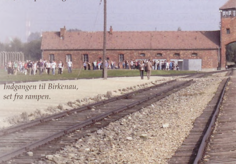
Indgangen til Birkenau, set fra rampen.

Onsdag startede vi på en tur til tvangsarbejds/kz-lejren i Plazow ved Krakow, den jødiske ghetto, Schindlers Fabrik m.v. Plazow er den lejr, som skildres i Schindlers Liste. Der var intet tilbage udover et stort og ret uvejligt terræn. Derefter besøgte vi den berygtede kommandant Amon Göths' villa, hvor