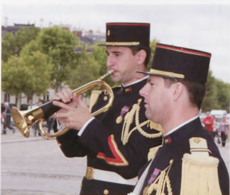
De to musikere er klar til ceremonien ved Triumfbuen ved mindesmærket for den ukendte soldat.

dejlige billeder. Efter et par timer fortsatte vi turen mod Paris.