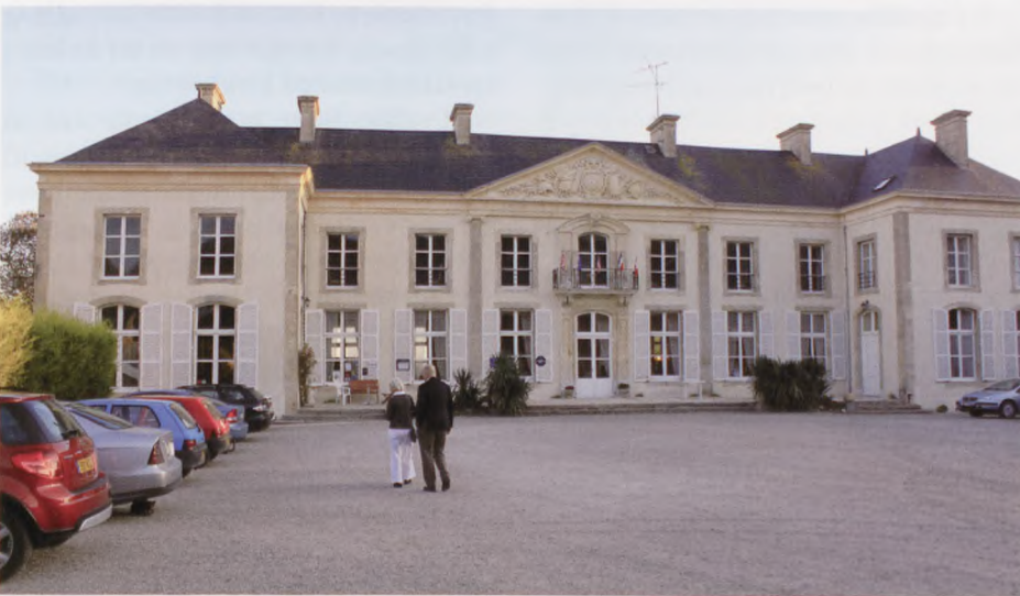
Slottet, som vi boede på i Normandiet.

Mindesmærket, som er rejst til minde om de 800 danske søfolk, der deltog i