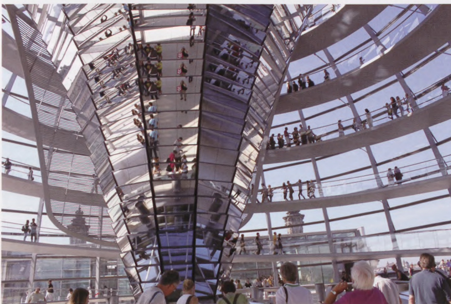
Rigsdagen i Berlin – søjlen, der går helt op i kuplen.

Med på turen var en deltager der fyldte 75 år denne dag, det fejrede vi