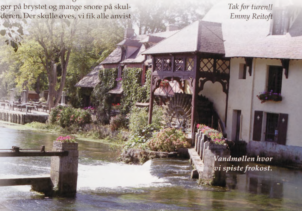
Vandmøllen hvor vi spiste frokost.