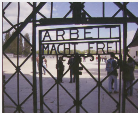
Indgangsporten til Dachau, med det berygtede slogan, som også står over indgangen til Auschwitz.

Fra dokucentret kørte vi til Berchtesgaden, hvor vi spiste frokost. Vejret var hele ugen utrolig smukt, så vi så det bayerske landskab fra sin smukkeste side. Det er for mig ufatteligt, når man så det meget smukke landskab og mødte mange venlige og imødekommende mennesker, at der engang har