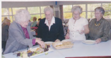
Der var kø ved osten...

Foreningens aktiviteter har som tidligere været præget af arbejdet for vore medlemmer. Der er stadig en del af vore medlemmer, der kan få hjælp fra Arbejdsskadestyrelsen, og vi prøver at hjælpe på forskellig vis med rådgivning i erstatningssager, indsendelse af medicinregninger til Arbejdsskadestyrelsen, ansøgning om enkeerstatning og hædersgave. Men der er ikke så mange, der behøver hjælp som før. Sidste år var vi 265 medlemmer, nu er vi ca. 250. Mange af disse er enker efter tidligere aktive og er derfor ikke omfattet af loven om hjælp til besættelsestidens ofre.