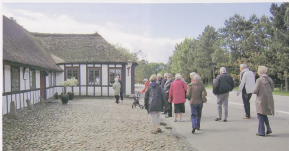
Selskabet på vej ind til den berømte æggekage på Hvidsten Kro.

Han fortalte i øvrigt om, at den lokale befolkning blev tvangsevakuert til landsbyen Ræhr, og nogle helt til Hirtshals, da tyskerne var nervøse for angreb og sabotage. I Ræhr blev der opført nogle træbarakker af meget dårligt byggeri, men det måtte folk tage til takke med, indtil befrielsen endelig kom i 1945.