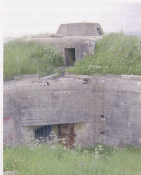
En af kanonstillingerne på fortet i Hanstholm.

Batteriet bestod af fire store kanoner, hvis rør hver vejede 110 tons, og kunne skyde ud til en afstand på 55 km., d.v.s. næsten halvvejs til Norge. Her i Hanstholm havde vi ligeledes en guide, som virkelig var inde i historien og kunne formidle det på en interessant måde.