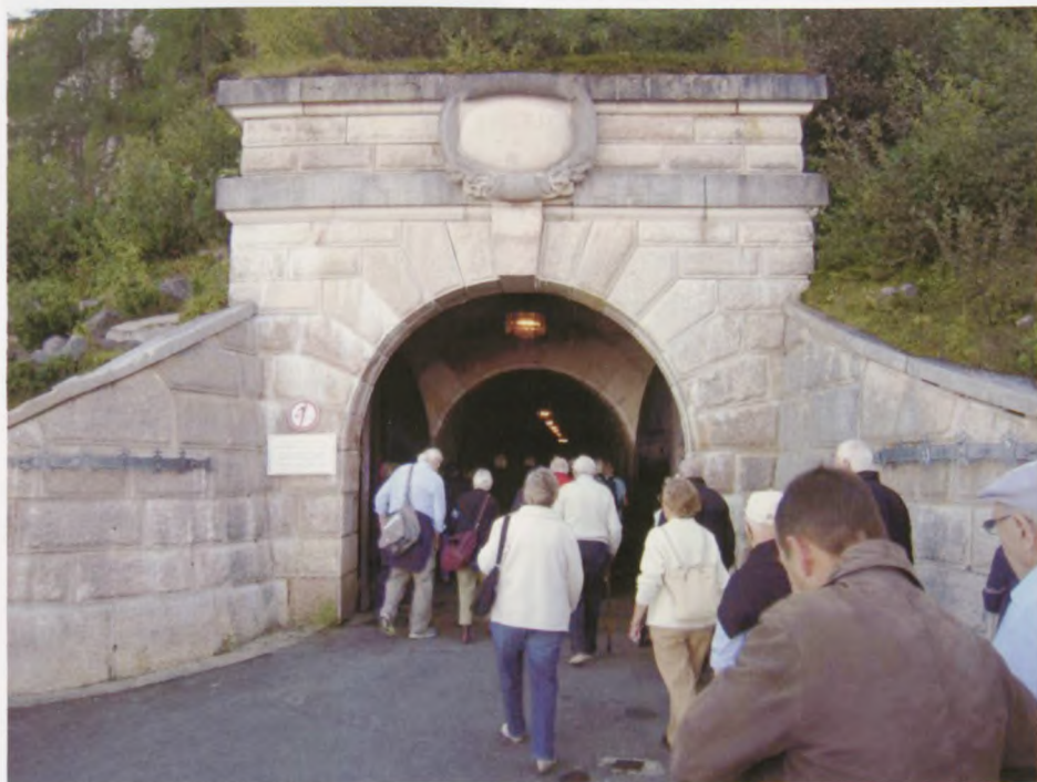
Den voluminøse indgang til elevatoren, der fører op til "Ørneborgen".

Torsdag gik turen nordpå med overnatning i Kirchheim. Og fredag vendte vi tilbage til Danmark efter en meget oplevelsesrig og tankevækkende tur til det sydlige Tyskland.