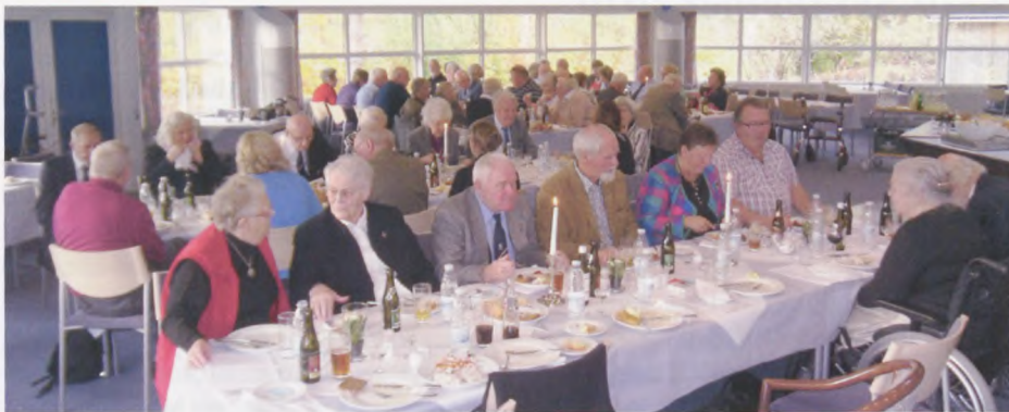
Deltagerne hyggede sig under frokosten.

I dag har vi kun 4 lokalafdelinger, mange har derfor temmelig langt til den nærmeste lokalafdeling og dermed sværere ved at holde kontakten vedlige