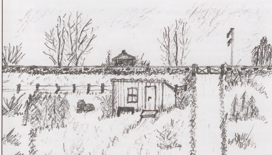
Depotet ved Bjerringvej, tæt ved jernbanen.