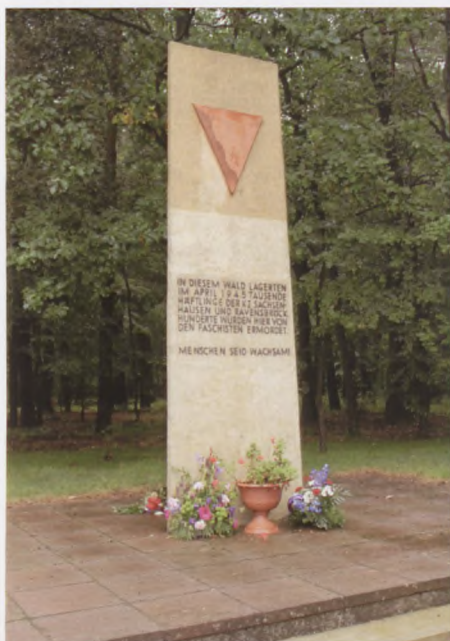
Mindesmærke ved Belower Wald.

rigt for at se en vandreblok, der under den sidste istid kom "vandrende" fra Bornholm, inden den lagde sig til rette tæt ved Usedom halvøen. Den kunne ikke lige medtages som souvenir, idet den vejede omkring 360 tons, men imponerende, der hvor den lå – det var den.