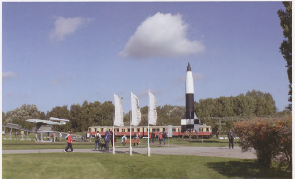
Museet for V1 og V2 bomberne.