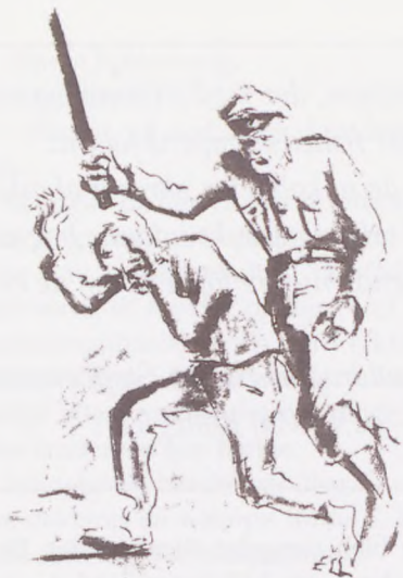
Under opsyn af SS