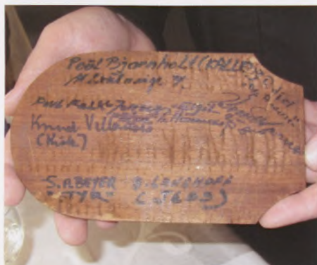
Den signerede bagside af HD-skjoldet.