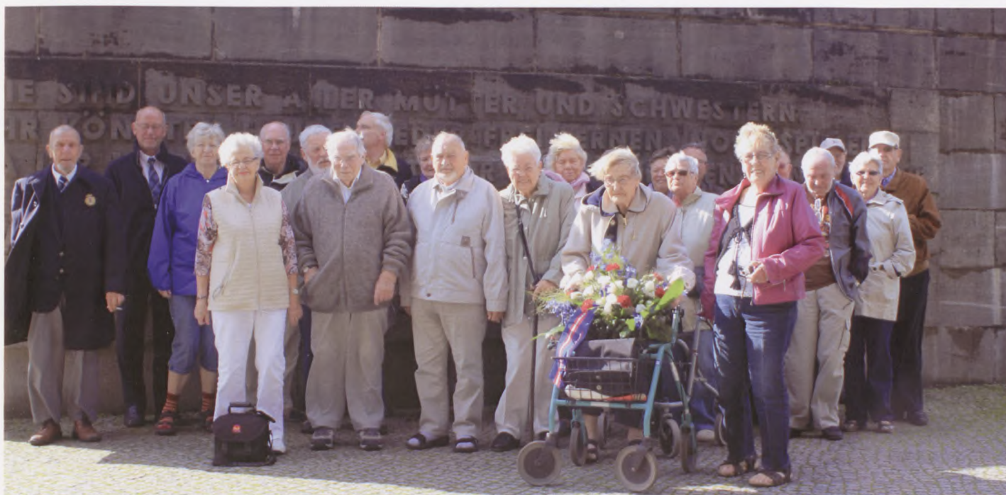
Rejseselskabet forevigt ved KZ-lejren Ravensbrück.

Hjemme på hotellet kunne vi hygge os i baren eller på værelserne efter mid-