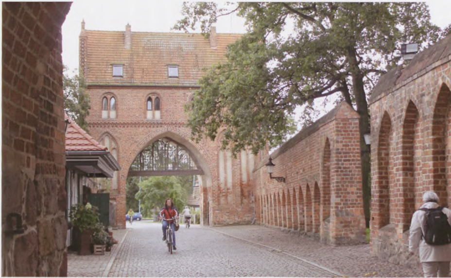
En af byportene i Neubrandenburg.

krigen havde deres "Refugium" – et af de steder, hvor de tog hen på sanatorium, når de trængte til at rekreation fra de "hårde opgaver". Byen ligger som en spøgelsesby, men med bevarede facader fra de huse, som lå i byen dengang. Efter endnu en kort tur kom vi til Lycken, hvor vi indtog dagens frokost, inden vi igen vendte hjem til vores hyggelige hotel for at slappe af, spise og hygge os.