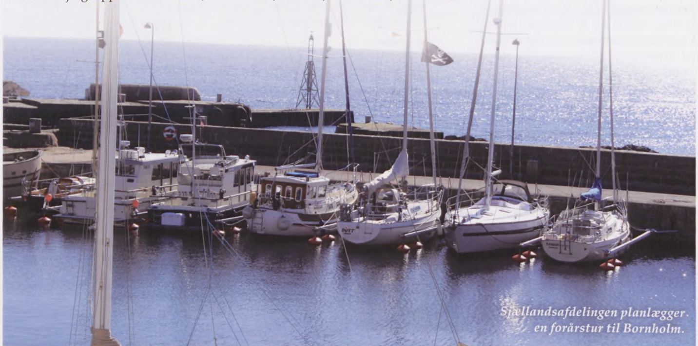
Sjællandsafdelingen planlægger en forårstur til Bornholm.