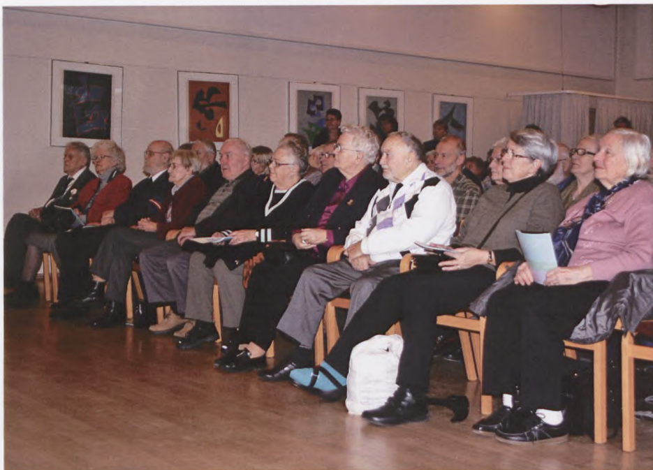
Udsnit af os fra Bernadottegården.