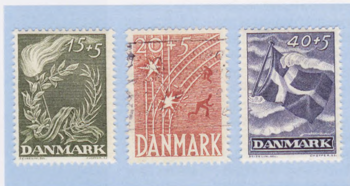
Tre af frimærkerne, som med 5 øres overfranking var med til at finansiere opførelsen af 4. Maj Kollegierne.

Således lød oplægget. Det gik noget anderledes. For det første fik Frihedsfonden ikke nogen biografbevilling. Det blev heller ikke Nationalfonden, der trådte til (med betegnelsen ”Nationalfonden” i den gamle forhandlingsprotokol må antagelig menes ”Fonden for Fædrelandets Vel”, der på da-