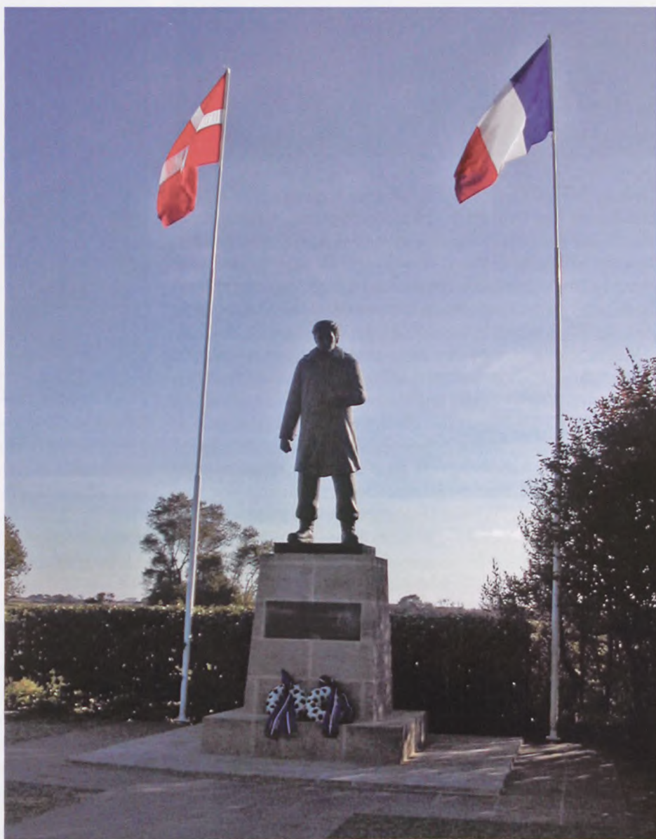
Mindesmærke i Normandier, omgivet af det franske og det danske flag.