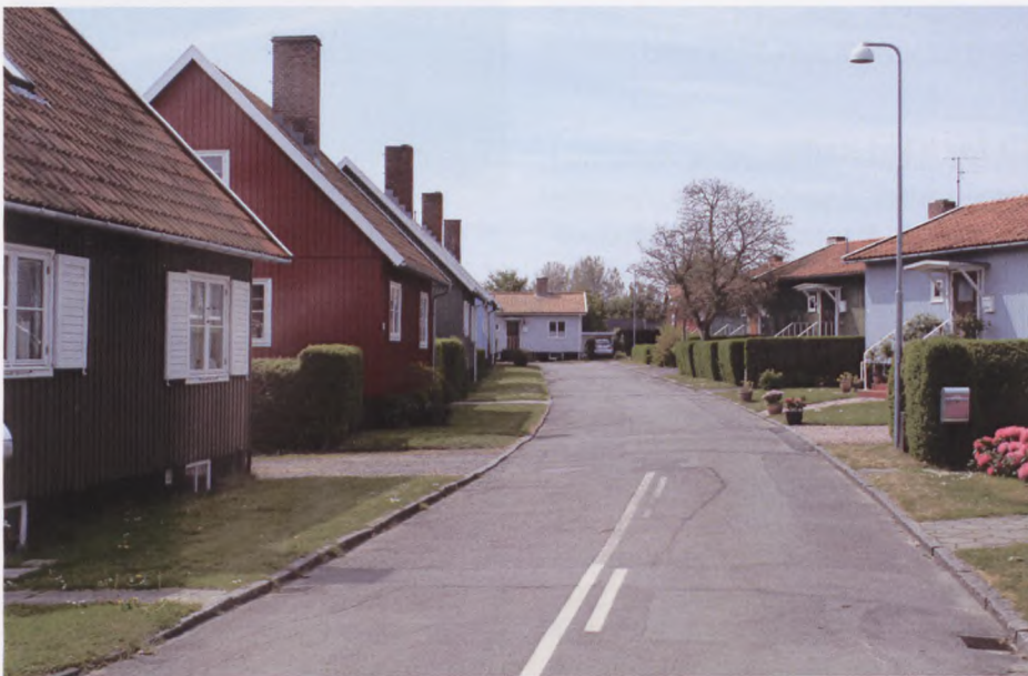
Svenskebyen i Nexø.

Efter morgenmad tirsdag, gik turen til Almindingen – Danmarks tredjestørste skov. Vi så først Ekkodalen. Vi forsøgte forgæves at råbe ekkoet op, og da det ikke lykkedes, fik vi en dejlig kop formiddagskaffe, og en "honningsyp" (bornholmsk specialitet, lavet af honning og Brøndum) og kørte derefter til Christianshøj, hvor vi så