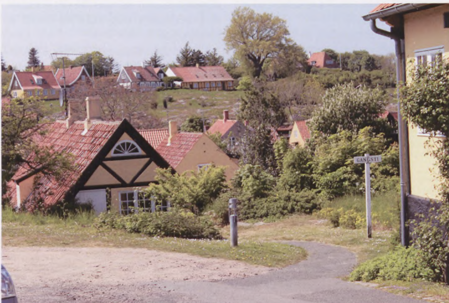
Fra Svaneke, huset hvor man går lige ind på 1. sal.