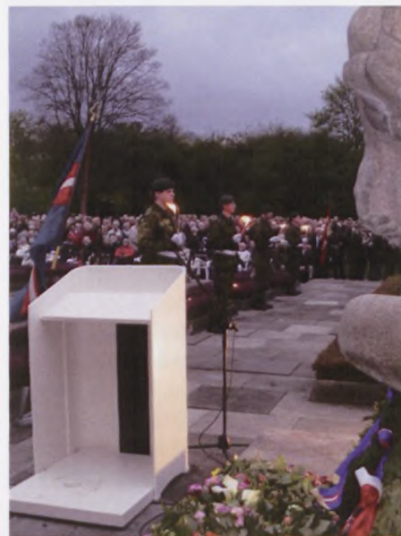
Hjemmeværnets lysvagt med Bernadotte-gårdens beboere blandt tilhørerne.