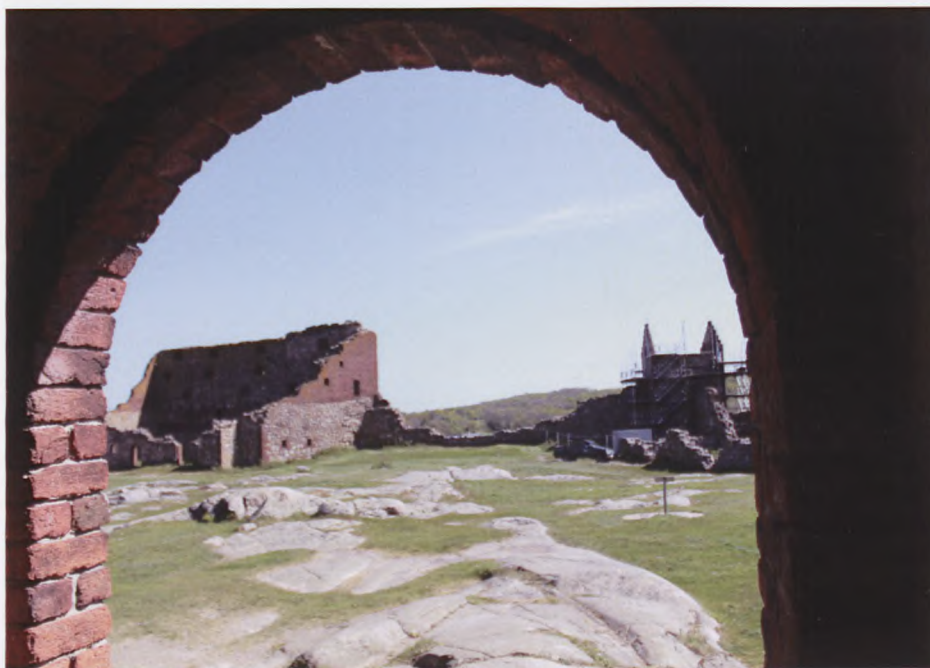
Fra Hammershus Ruiner.

var, at billederne af de to børn, hun havde mistet, nu var væk og ikke til at erstatte. Min tante, der var højgravid, cyklede til Østermarie med et barn bagpå cyklen og en ved siden af, hun fødte d. 11. maj.