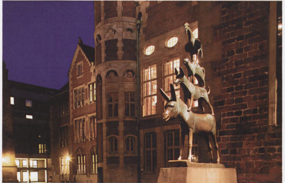
Aftenstemning i Bremen med skulpturen Bremer Stadtmusikanten.

I og omkring Bremen vil vi se interessante steder, der har relation til kri-