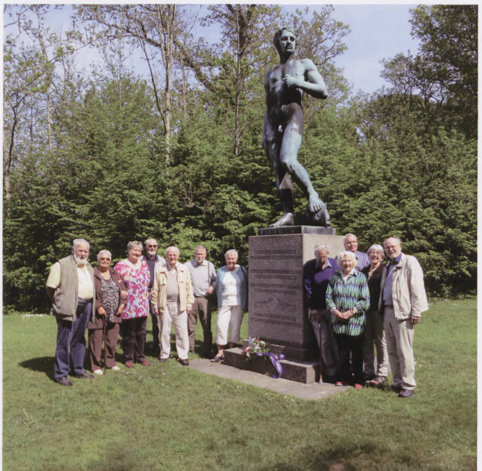
Gruppebillede ved Davidstatuen.

Tirsdag aften havde jeg selv fortalt om, hvordan det gik min mors familie, der den gang boede i Nexø: Min morfar og mormor mistede alt, hus og hjem, forretning og alt hvad der var i hjemmet. Min mormors eneste store sorg