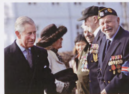
Prins Charles hilser på veteranerne.