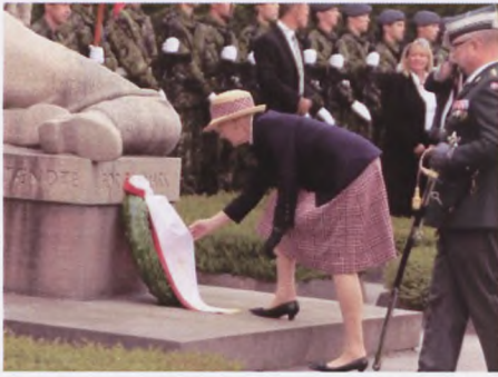
Dronning Margrethe lægger krans ved monumentet.

god tid til at se sig om og hilse på de forskellige.