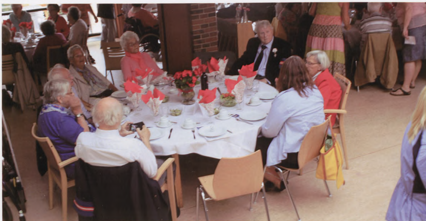
Der var 150 deltagere ved middagen på Bernadottegården 29. august.