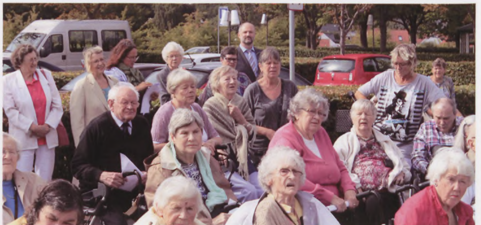
Et udsnit af deltagerne ved mindehøjtideligheden.

Forud for den tyske besættelsesmagts ultimatum til den danske regering havde der været en bølge af strejker, demonstrationer og sabotageaktioner imod besættelsesmagten. Der var røster i befolkningen, der mente, at nazisterne var ved at tabe krigen og andre i modstandsbevægelsen, der forsøgte at få den danske regering til at stoppe sit samarbejde med den tyske besættelsesmagt. Det hele lagde et pres