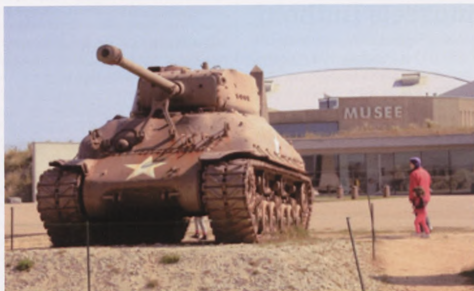
Utah Beach Museum i Frankrig.

nærmere manglen på formidling. For selv om det danske mindesmærke har været en del af den fredfyldte Normanniske natur siden 1984, har der ikke været ressourcer til at få budskabet om krigssejlerne formidlet ud. Det største problem var, at der ikke var kilder skrevet på fransk eller sågar engelsk. Derfor var ledelsen på museet også positive over for mit forslag, i forhold til at etablere en midlertidig udstilling omkring de danske krigssejleres indsats i Normandiet. Udover at deltage i det daglige arbejde ved museet og planlægge den årlige ceremoni i anledning af D-dag, bestod mit arbejde nu i at fremstille denne udstilling. Jeg påbegyndte min research, og blev gradvist mere og mere bevidst og oplyst omkring de ofre, de danske krigssejlere har gjort under 2. verdenskrig. I fem år var mange af disse unge sømænd fanget på havene rundt om i verden, uden at vide, hvordan deres skæbne ville tage form. Det var derfor med en god portion ærefrygt at udforme denne udstilling, da jeg ikke