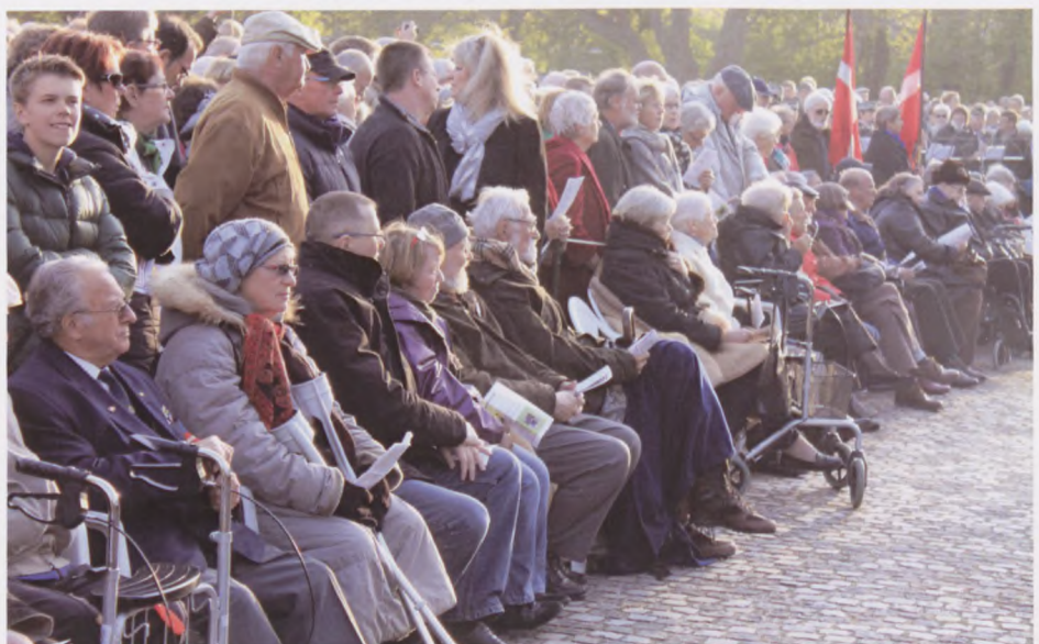
Bernadottegårdens beboere har altid de bedste pladser.