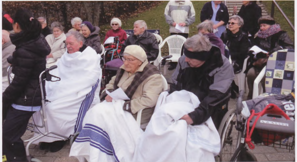
Det var en kold og blæsende dag den 9. april...

Inde i hus 4 var der dækket borde med kaffe, Gammel Dansk, rundstyk-