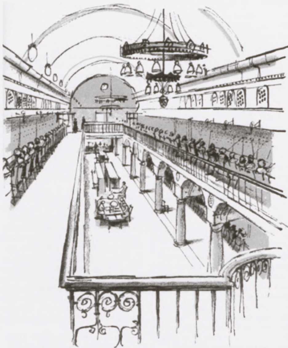
Hovedtelefoncentralen i Nørregade.

Den dag politiet blev taget, den 19. september 1944 om morgenen/formiddagen, havde man også fået "nys" om på telefoncentralerne, at der ville "ske noget". Nogle på min mors arbejdssted prøvede at ringe og advare de københavnske politistationer. Der blev bare sagt, at tyskerne ville komme, og man skulle se at komme væk. Men tyskerne havde allerede besat nogle af politistationerne, og på flere politistationer tro-