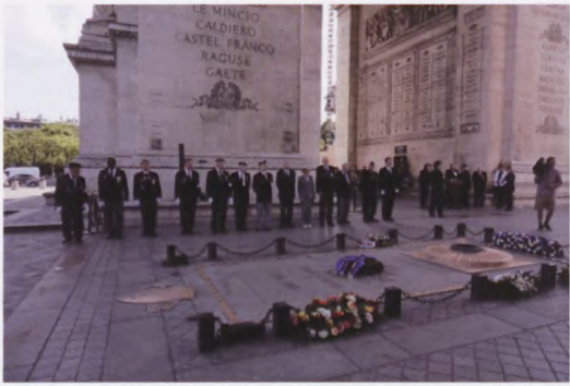
Glimt fra de begivenhedsrige dage i Frankrig.