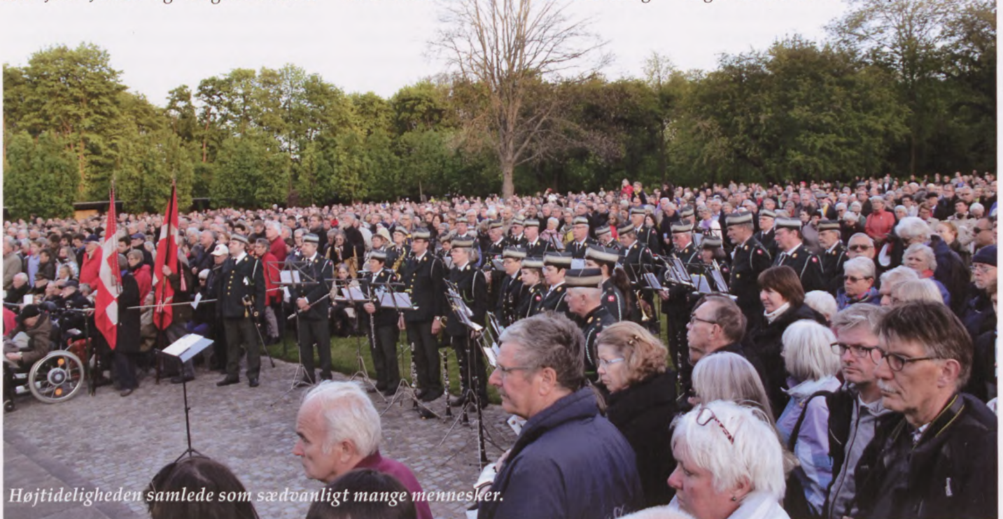
Højtideligheden samlede som sædvanligt mange mennesker.

Det sker blandt andet ved at støtte op om de traditioner, der omgiver besættelsen. Vi har en pligt til at være med til at erindre. Vi skal sørge for, at andre kan huske dem, der måtte ofre deres liv for noget de troede så fast på, at det de