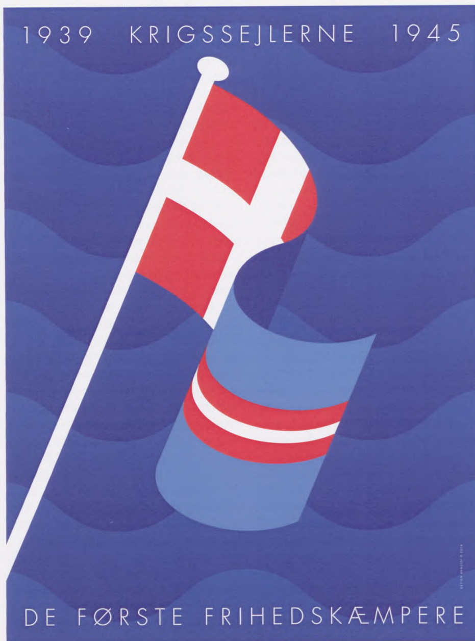
Den danske udgave af Per Arnoldis plakat. Den er også lavet på engelsk og fransk.

Ud af de 254 danske skibe ved krigens udbrud kom de 128 ikke hjem til Danmark igen, og det er dokumenteret, at mindst 83 af dem blev torpederet. Og af de 6.300 danske søfolk omkom 1.084 under krigen.