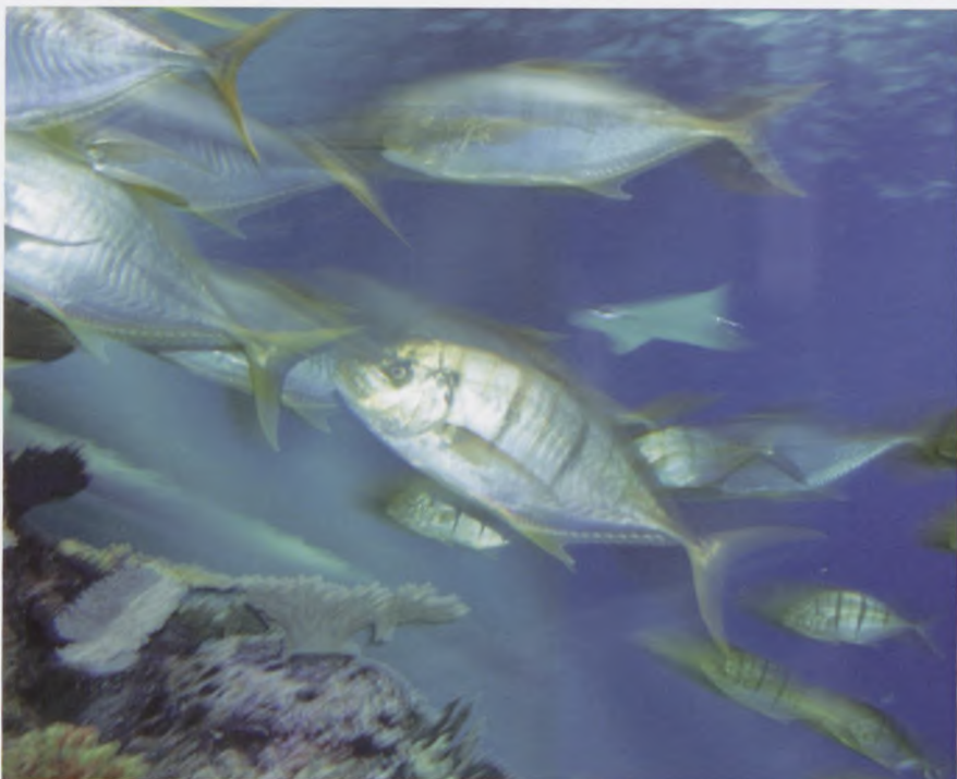
De flotte fisk i Den blå Planet blev beundret.