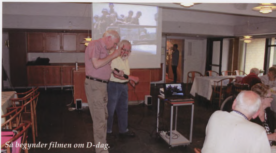
Så begynder filmen om D-dag.