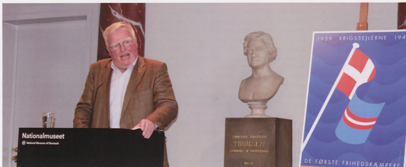
Per Arnoldi fortæller om arbejdet med at skabe plakaten.