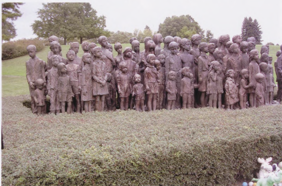
Børnene i Lidice.

Onsdag gik turen til Theresienstadt, og som alle ved, var det her de danske jøder blev deporteret til. Ghettoen (garnisonsbyen Theresienstadt) blev officielt oprettet som ghetto den 1. maj 1942. Den var udelukkende beregnet til