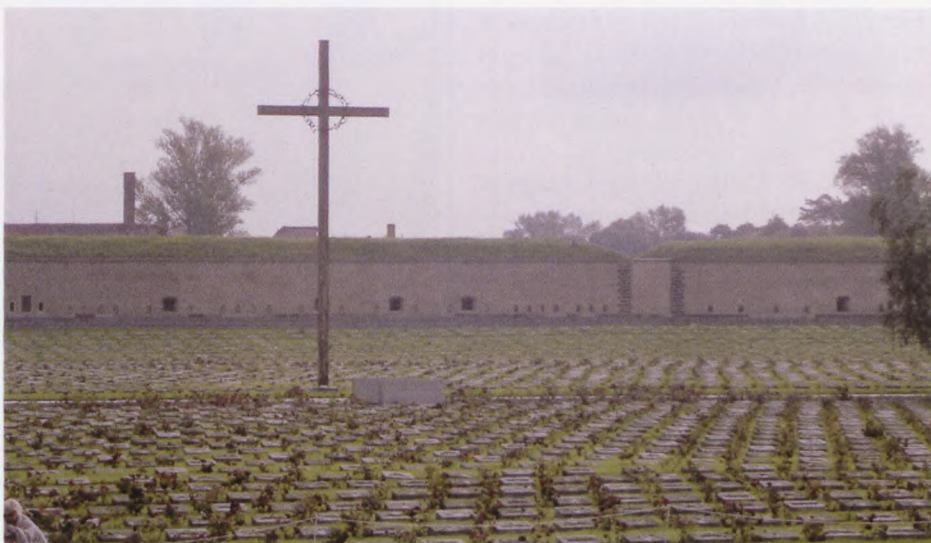
Den Jødiske kirkegård - Theresienstadt.

Fra besøget i Theresienstadt, fortsatte vi til Lidice nordvest for Pragh, byen der blev totalt ødelagt og brændt ned som gengældelse for attentatet mod Heydrich. Den 10. juni 1942 blev alle mænd ned til 15 år myrdet, kvinder og børn blev skilt, nogle få børn blev udtaget til tyske SS-familier, nogle blev sendt til udryddelseslejren Chelmo, og kvinderne blev sendt til Ravensbrück.