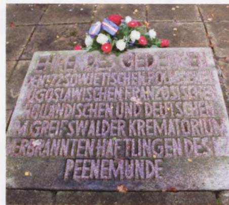
FIR mindesmærket ved Neuen Friedhof ved Greifswald.