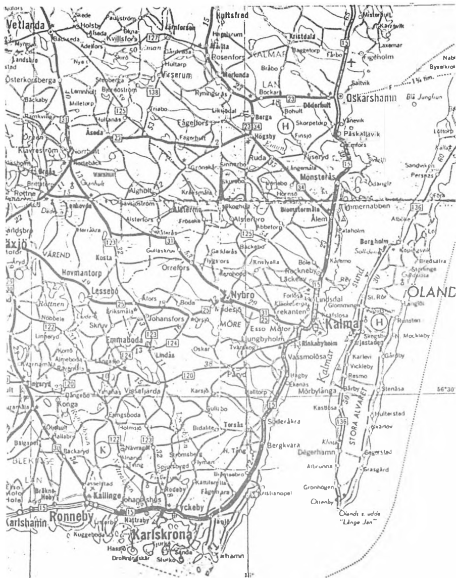
Kort over Sydösterrike m/RÄVABILE.