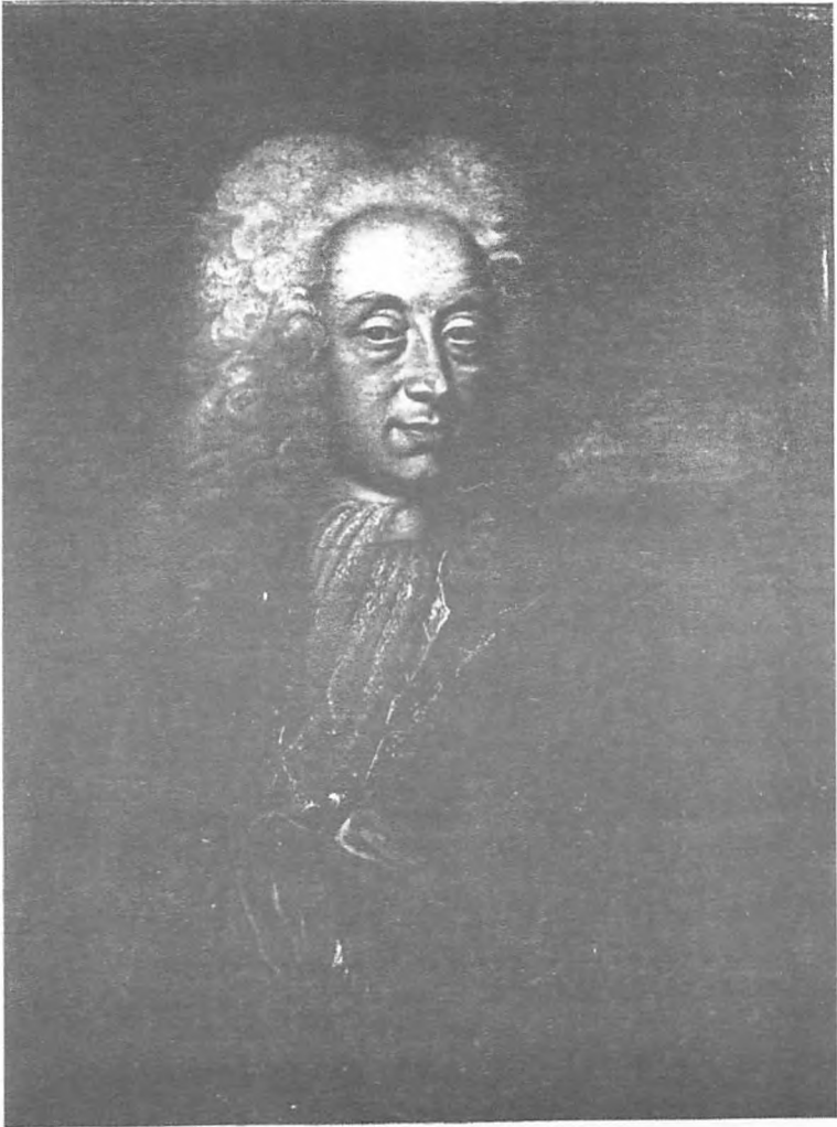
Ole Rømer (1644-1710)