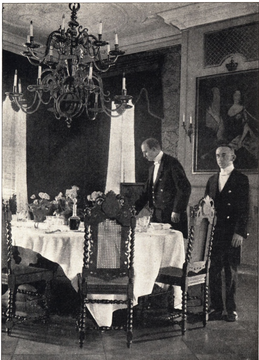
Middagstaflet dækkes. Vemmetofte.