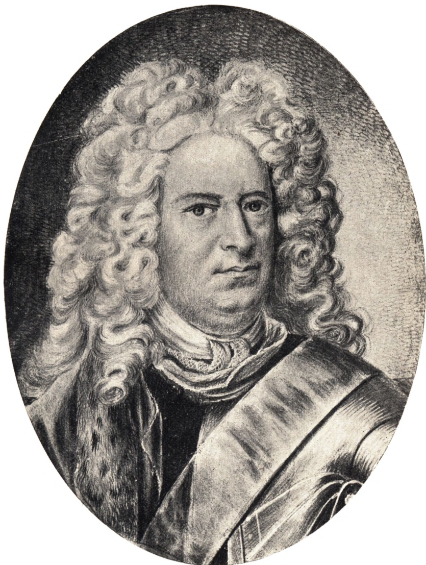
Jobst v. Scholten, Overgeneral, Stamfader til den danske Scholtenske Linje.