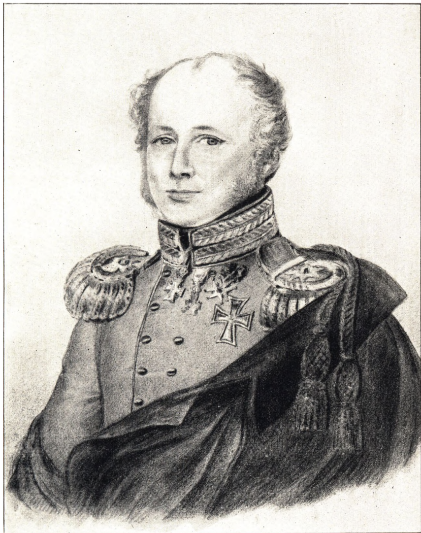
Generalgouverneur v. Scholten.