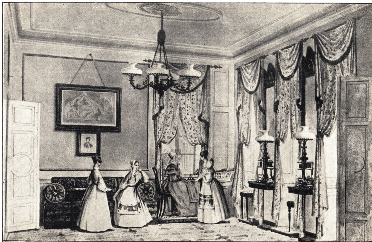
Et Interiør fra et fornemt Hjem paa Frederik den 6tes Tid.