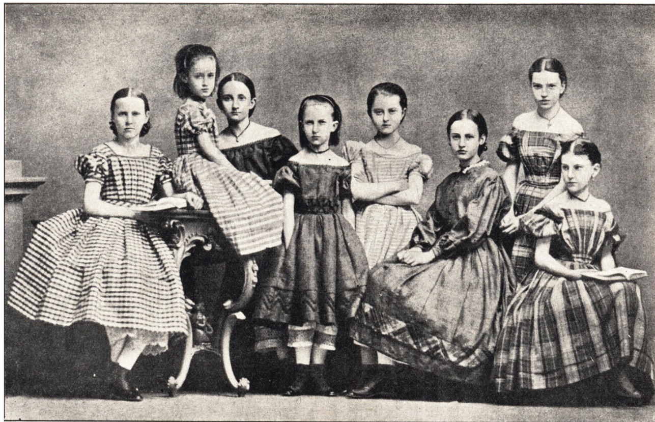
Skolens første otte Elever.