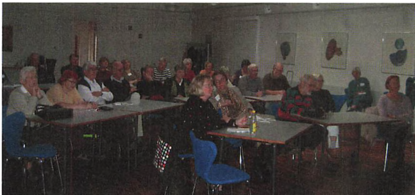
Interesserede tilhørere til foredrag