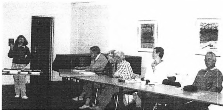
Foredrag om uægte børn

Derefter havde vi et møde, hvor vi kunne få hjælp til slægtsforskningen eller hjælpe andre, der var gået i stå af den ene eller anden grund. Pressen kom på besøg for at høre, hvad vi var for nogle!