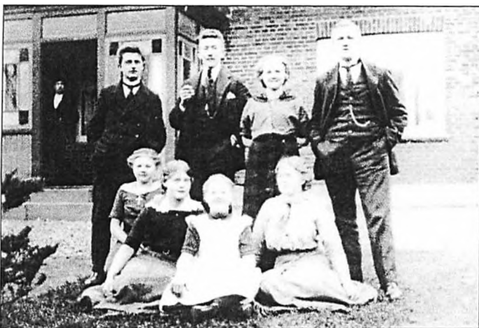
Morfar til højre - pigerne er hans søstre og min mormor

Vejrup lokalarkiv kendte udmærket billederne, jeg kom og fremviste, rigtig mange af dem stammede jo fra deres kro, så noget der for mig var totalt ukendt, vakte minder og historier frem om en familie, der havde været lidt af en institution på egnen.