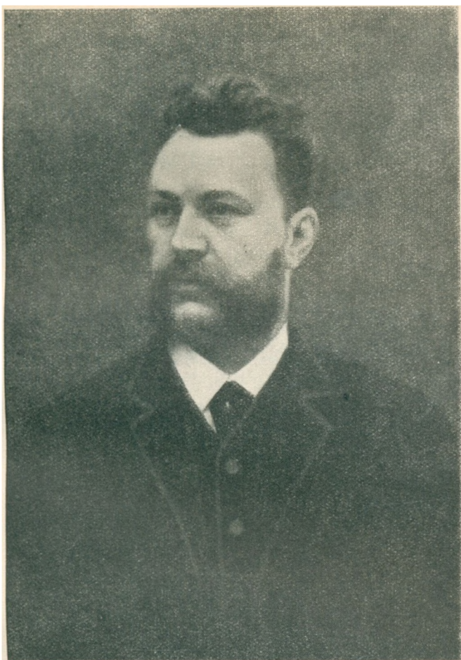
CARL F. JOHANNESSEN Efter maleri av Gudmund Steensen.