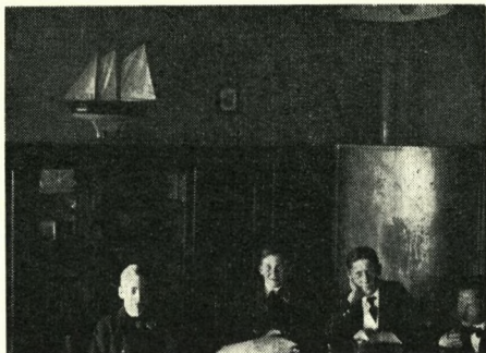
Fra kammer nr. 2 på Alumnatet 1913-14.

så forfærdelig pludselig. Men han blev da skånet for at møde døden i kamp, en tanke, han ikke så sjældent havde gjort sig. – Sigurd var det mest naturlige og ligetil, når han var hjemme. Han tog aldrig teatrets problemer med hjem. Var der noget, der optog ham, gik han en lang tur og tænkte over den opgave, han stod overfor at skulle løse. Han repræsenterede en skuespil-lertype, der næsten ikke eksisterer mere.«