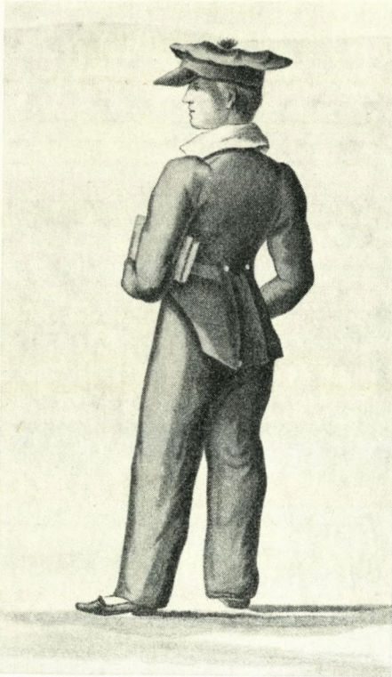
Den ældste Soraneruniform fra 1827. (»Den blaa Dreng«).

tøj, og i 3. real og 3. g må blå blazer med skolemærke anvendes fra 1. januar.