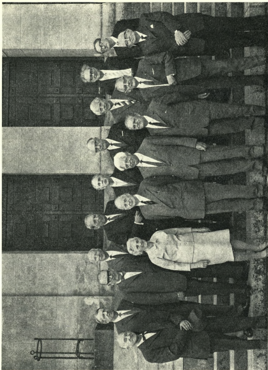
50-års studenterjubilærer, årgang 1920.