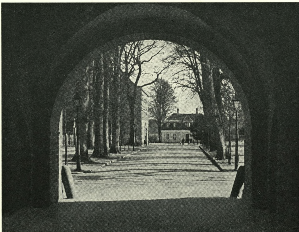
Fot.: Hagen Hasselbalch