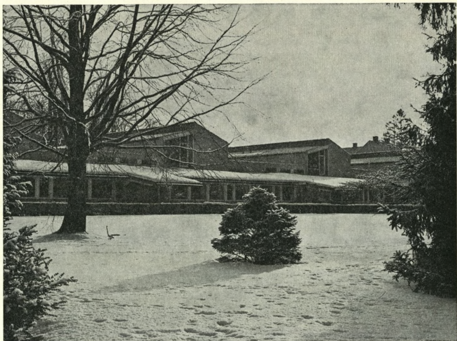
Vinterbillede af det ny alumnat set fra parken. Sv. Gerner Andersen har taget billedet, men sandheden kræver oplyst, at det ikke er i år, han har gjort det.