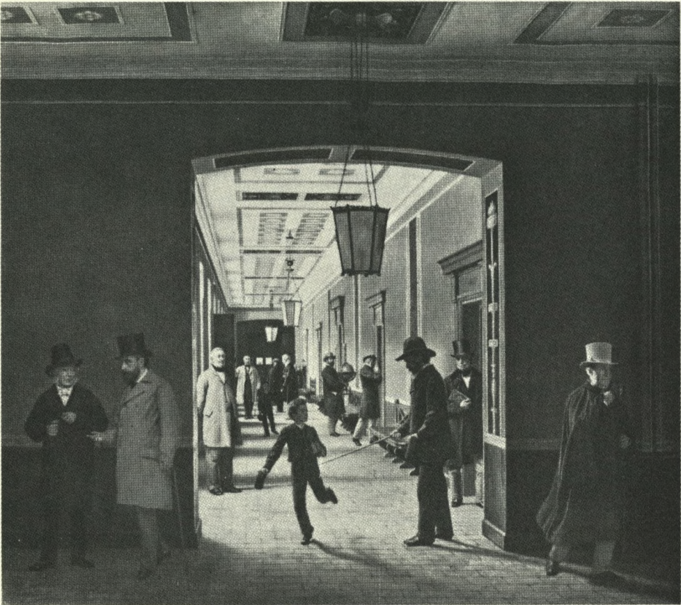
Christen Dalsgaard (1824-1907): Stengangen på Sorø Akademi, 1871.

Dette billede pryder forsiden denne gang for at introducere en ny idé, som det herefter står enhver soraner frit for at benytte sig af... (læs videre på side 103-104).