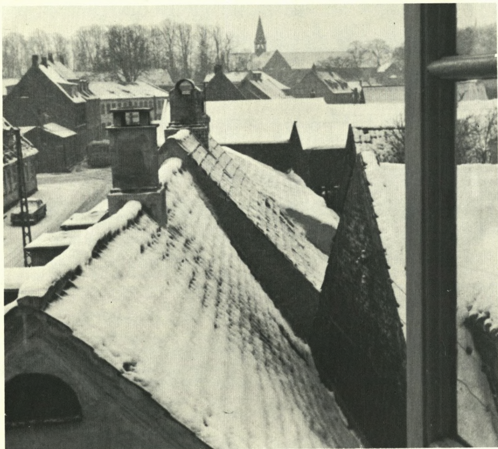
Vinterstemning i Sorø