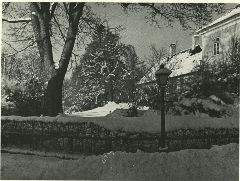
Vinterstemning i Akademihaven