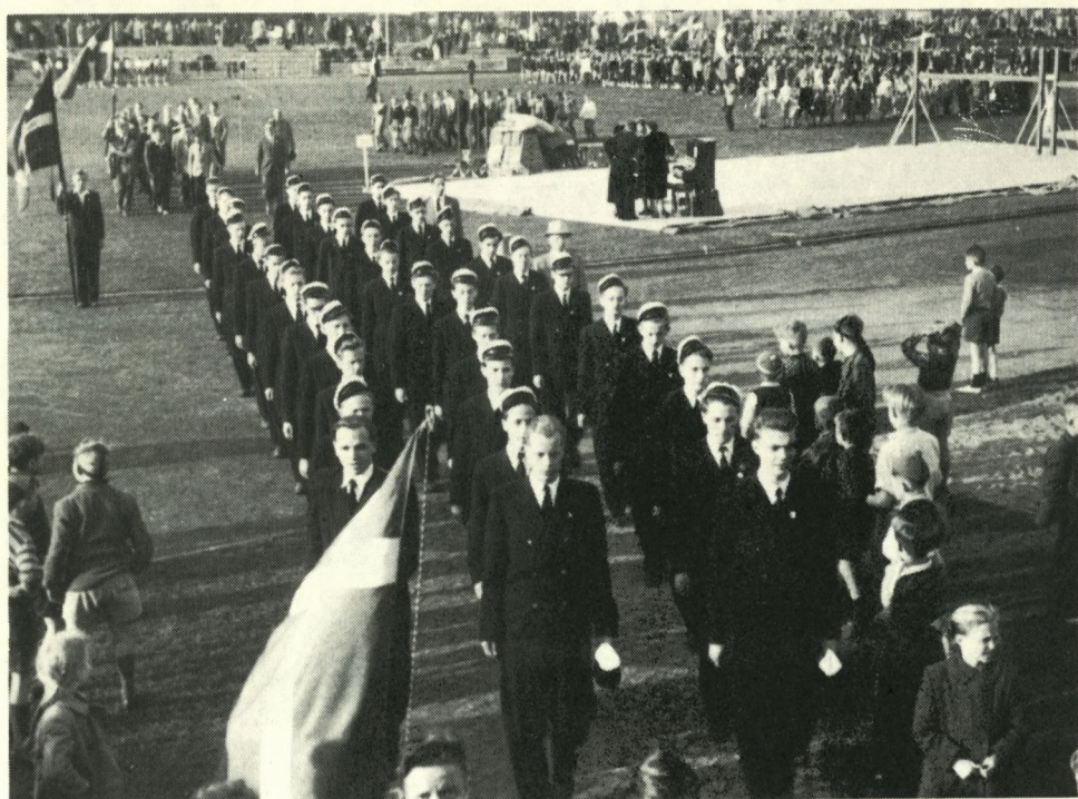
Idrætsstævnet i Aabenraa 1951

12-14 år, vil en film om Sorø Akademi skole kunne være til gavn og glæde for ungdom i hele Danmark.