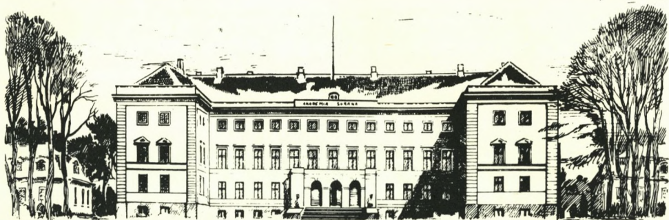
Chr. Tom Petersen Academid Sorana