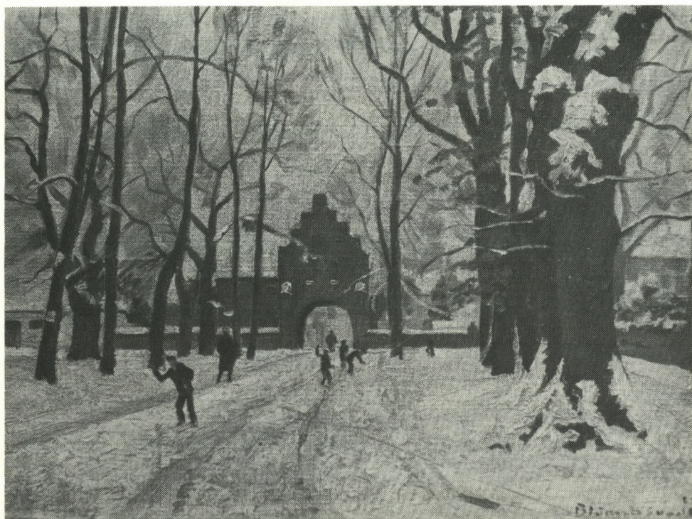
Klosterporten i sne (1922)