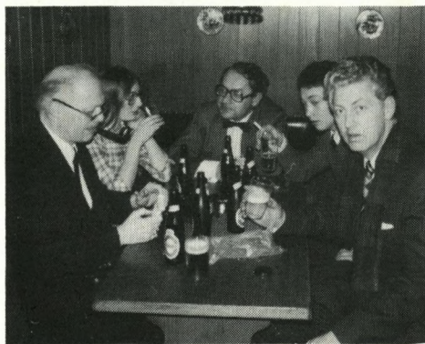
Nachspiel hos Prætoria