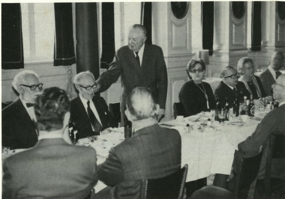
C. C. taler ved soranerfrokosten 6.3.75