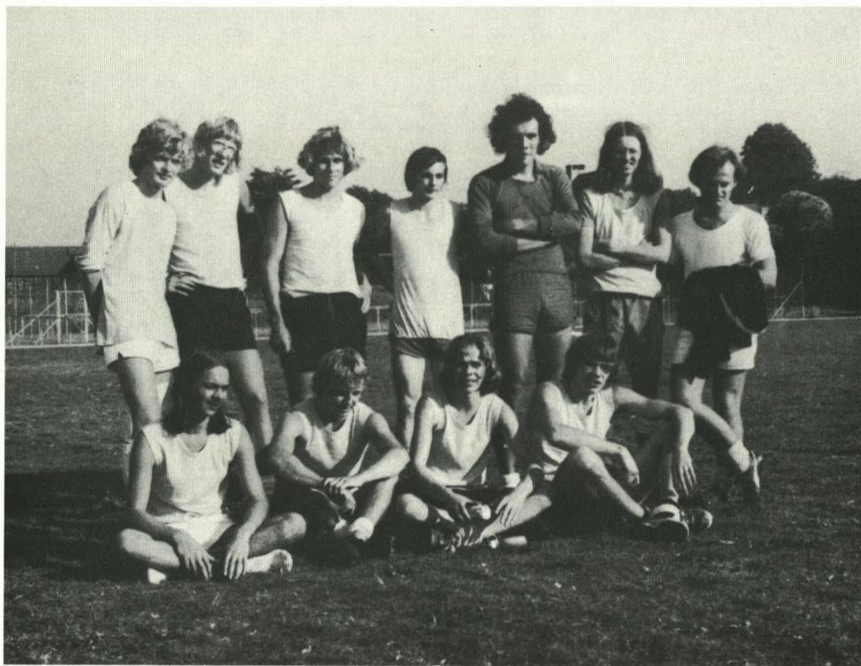
"Nye gamle soranere"