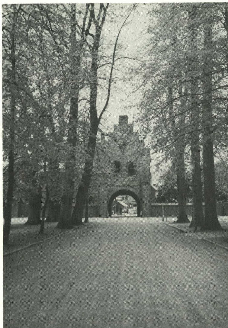
fot. Sven Gerner Andersen (R 1945)