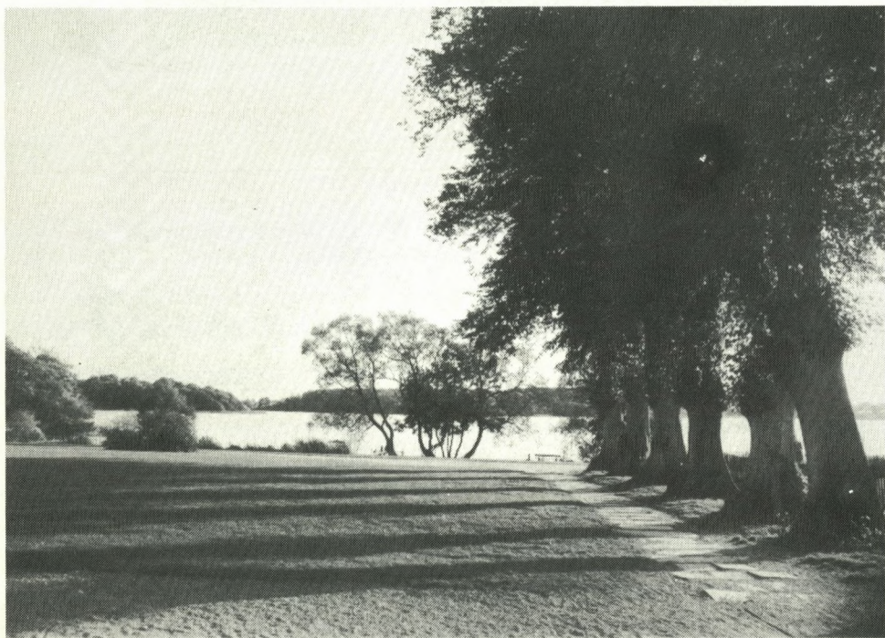
fot. Sven Gerner Andersen (R 1945)