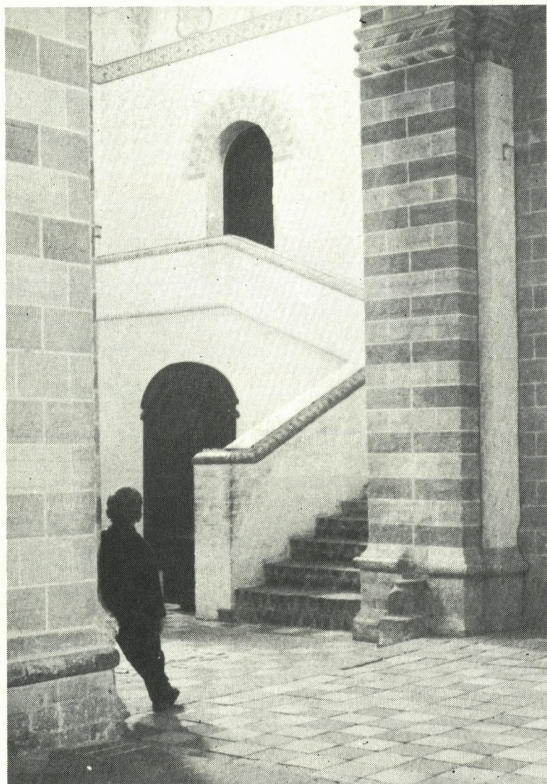
(R 1945)