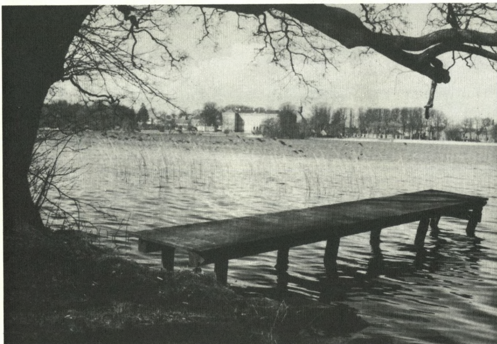
(R 1945)