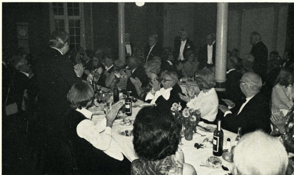
Formanden hylder jubilarene.