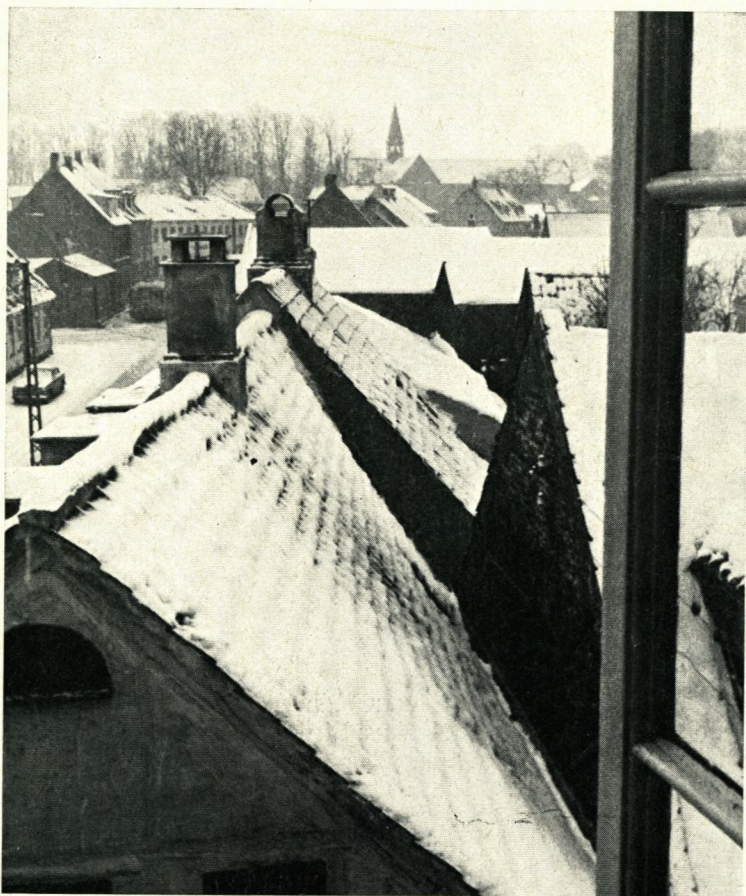
Sorø i sne