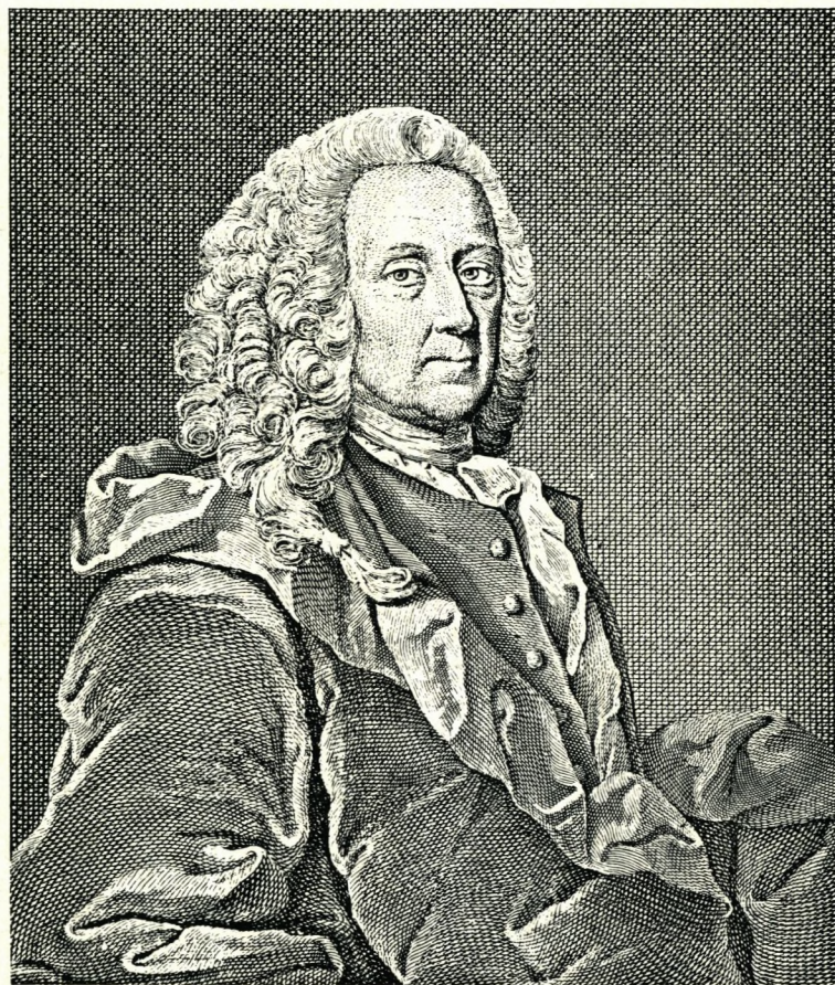
Ludvig Holberg efter stik af O. H. de Lode 1752.