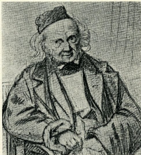
Marstrands udkast til et portræt af Ingemann fra 1859.

Hos Ingemann blev man god og bedre. Historien om akademi-nissen og akademi-gartneren af samme navn.