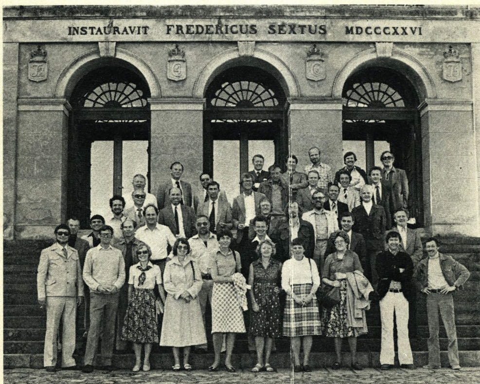
25-års studenterjubilærer på lang weekend i Sorø i juni 1979